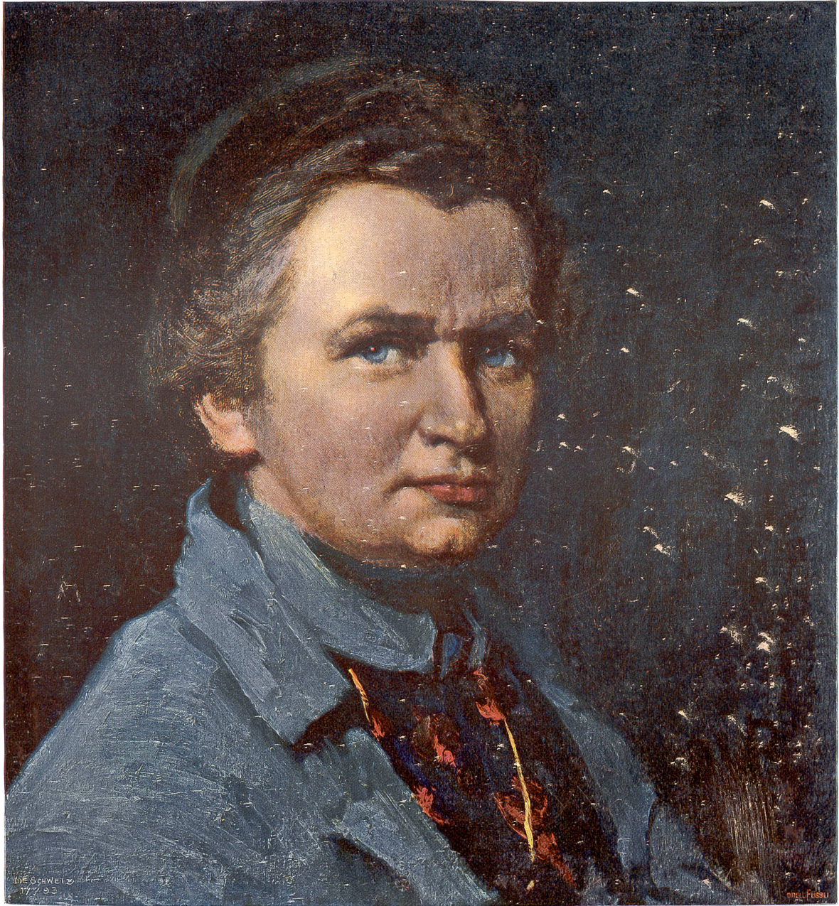
Offilie W. Roederstein.