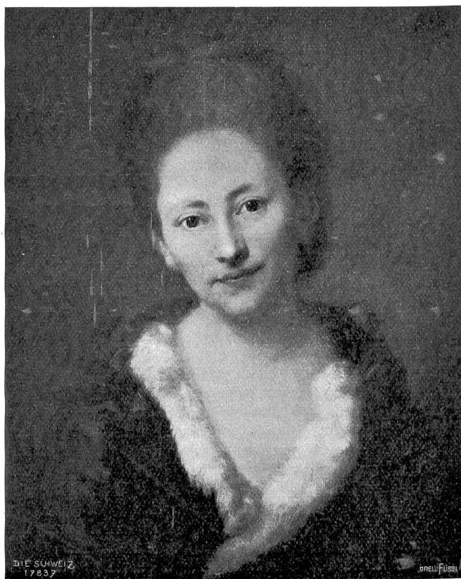
Anton Graff (1786—1813). Guste Graff geb. Sulzer, des Künstlers Gattin (1772). Original in der Winterthurer Kunsthalle.

Leser einschläfern können. Man hätte die Teufel und die Götter der veralteten Mären erstehen lassen, mit den