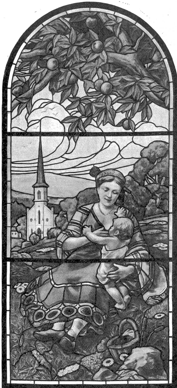
Richard A. Nüscheler, Zürich. Mutterglaube. Glasgemälde in Villa St. Niklausen bei Luzern.

und daß der leitende Künstler mit Festigkeit dem von ihm erstrebten künstlerischen Ziele zusteuere. Wohl gewann Nüscheler eine Reihe von hohen Gönnern, für