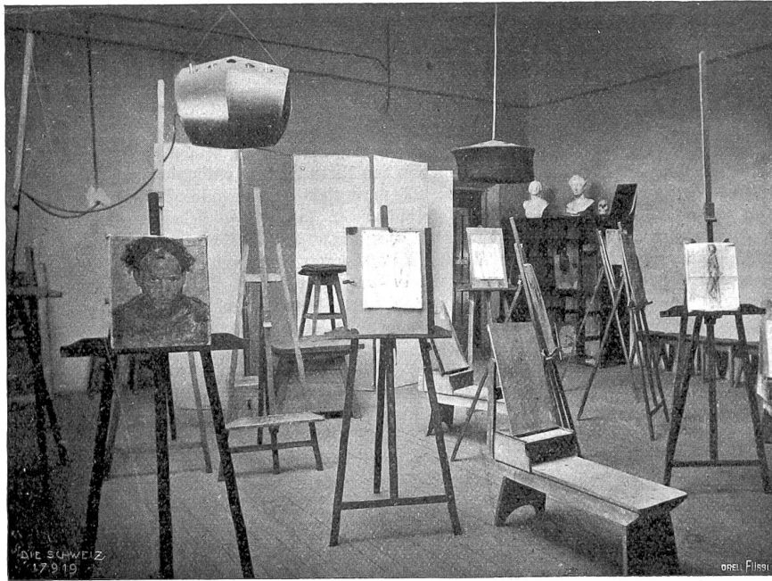
Eine schweizerische Kunstschule in Florenz. Maleratelier.