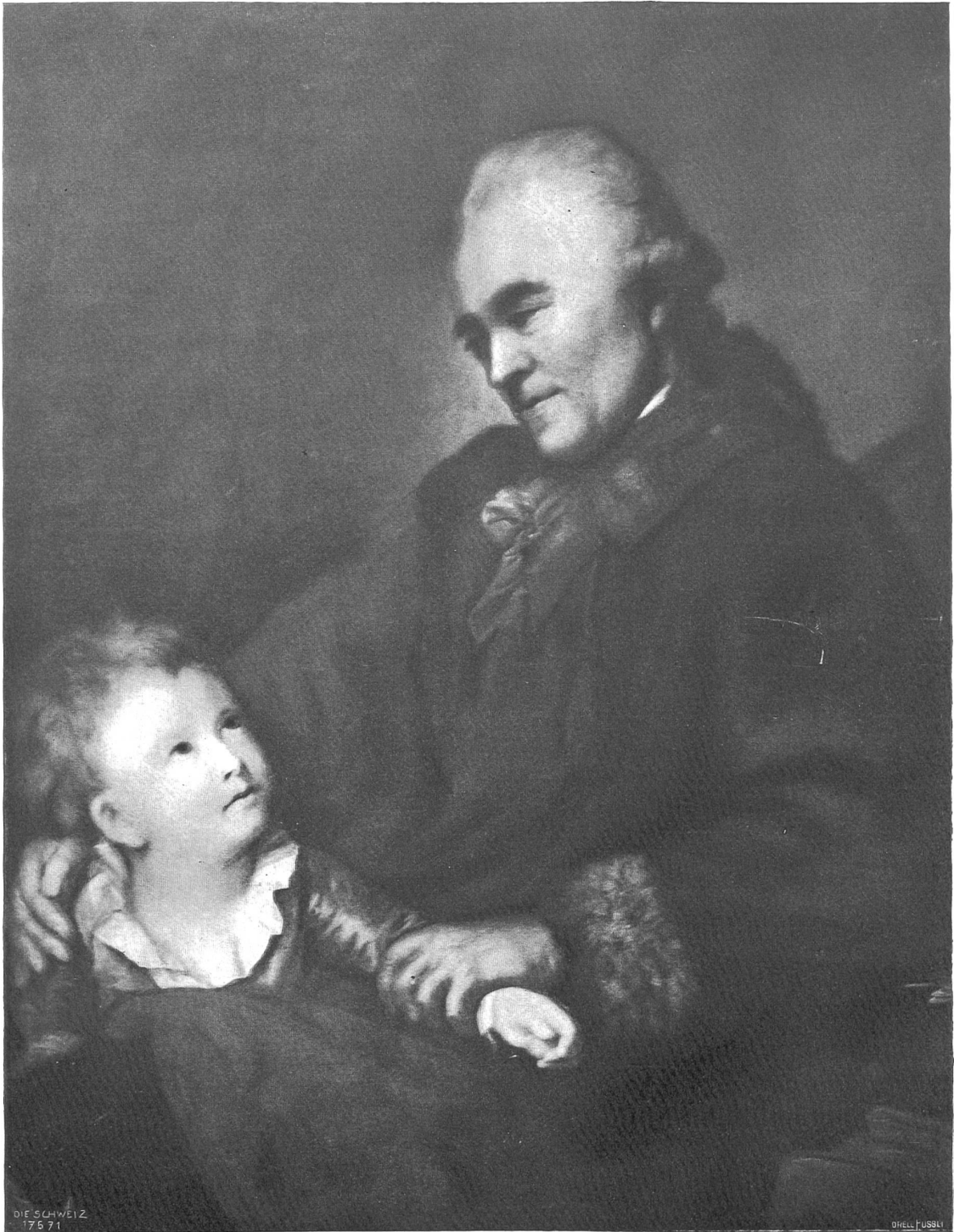
Anton Graff (1736—1813).