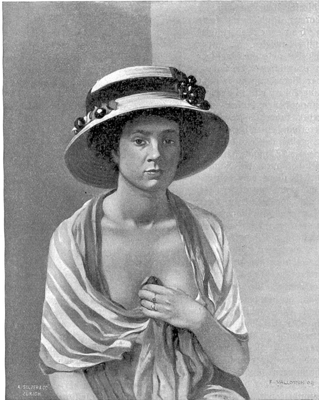
Felix Vallotton, Iaulanne-Paris.

von 1798 Schulpflichtigen 762, also etwa die Hälfte, positiv reagierend, tuberkulös gefunden. Dabei schwankte der Prozentsatz von 20—25 % in einigen Dörfern, die reinlicher waren, bis 80 % in Dörfern mit notoriously schmutziger Bevölkerung. Aber nicht nur die Reinlichkeitsbedingungen, die schlechten Wohnungen gaben ihm eine Erklärung dafür, es kommen noch andere Faktoren mit in Betracht. Interessant sind seine Erhebungen über größere oder geringere Anzahl positiver Pirquets in bezug auf Vorhandensein ansteckender Tuberkulosefälle in der Familie oder nicht. Es fanden sich positiv reagierende Kinder auch in Familien, wo keine offenen Tuberkulosen in der Umgebung waren, aber in keinem einzigen Fall, wo solche offene Fälle im Haus waren, fehlte die Pirquet-Reaktion bei den Kindern. Nach Jacob sind Maßnahmen auf dem Lande mindestens ebenso wichtig wie in der Stadt. Ich führe einige Details seiner Angaben (Brüsseler Konferenz) im Folgenden an: Not tut ausreichende