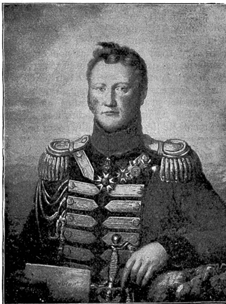
Graf Charles d'Affry als General, Kommandant der Schweizergarde. Nach dem Delbildnis im Besitz des Grafen de Saint-Gilles, Bischof von Freiburg.

das Feuergefecht und wiederholte energische Bajonettangriffe der Schweizerbataillone zum Rückzug bewogen. Als aber Tschitschagow etwas später acht neue Infanterieregimenter ritlings der Straße Stachow-Brill anzusehen und mit diesen den Durchbruch zu erzwingen beschloß, erlitten die gelichteten Schützenlinien der Schweizer größere Verluste als je zuvor; der beschneite Boden war weithin rot gefleckt von den Waffentrümmern, dem Blut der roten Schweizer und der Polen; im ganzen wurden sieben Bajonettangriffe ausgeführt, und siebenmal wurden die Russen blutig abgewiesen. Von den Stabsoffizieren der vier Schweizerregimenter stand nur noch der Major Im-