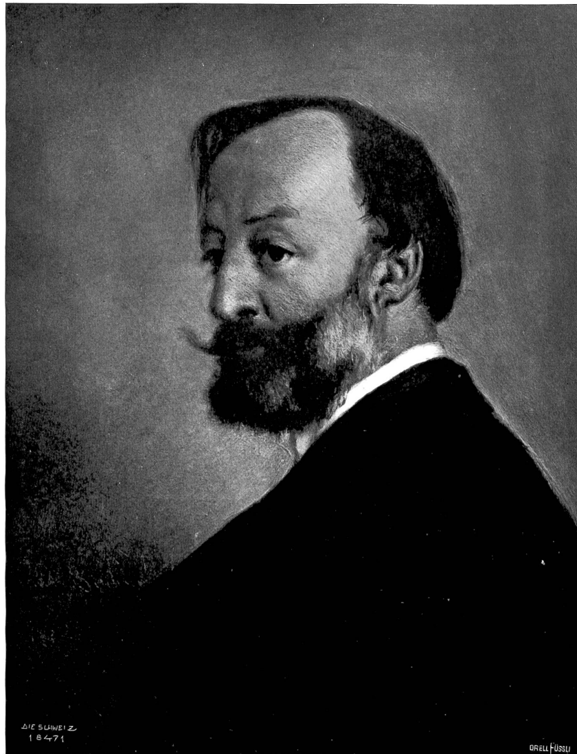
Frank Buchser (1828—1890).