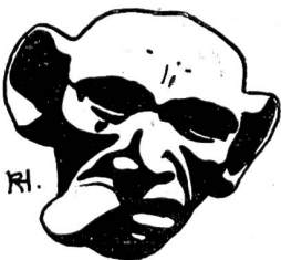
Frage am Spalentor in Basel.