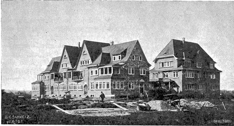
Moderne Architektur in Basel Abb. 8. Bierhäusergruppe an der Realpforte (Arch. Gutzwiller & Moser, Karlsruhe).

ihre Entwürfe. Wahrlich, ich lebe in einer großen Zeit! — Ganz anderer Art als der Eindruck der Zürcher Bahnhofstraße, abgesehen vom Architektonischen, ist schon das Leben und Treiben auf Basels Hauptverkehrsader. Basel hat keine „geborene“ Hauptstraße. Es hat weder einen Geschäfts-, noch einen Bummel-, weder einen Tag- noch einen Nachtfors. Die Italiensfahrer des Mittelalters haben die lebensfrohe Sitte des abendlichen Lustwandels zugleich mit dem Wort spaziare aus dem Süden zu uns gebracht, und im Lauf der Jahrhunderte hat sich in den meisten Städten nordischer Länder ein Straßenzug zum gemeinsamen Zentrum des geschäftlichen und gefelligen Lebens entwickelt, wo der Börsianer „tief verderbt und seelenlos“ am tändelnden Badfisch vorbei sich zu seinem Tempel „schlängelt“. Und wie Busch dies Treiben schildert: