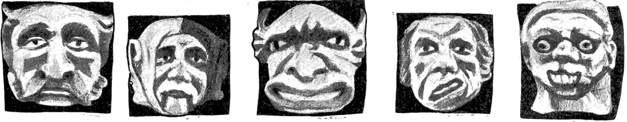
Farbige Fragen am Basler Rathaus.