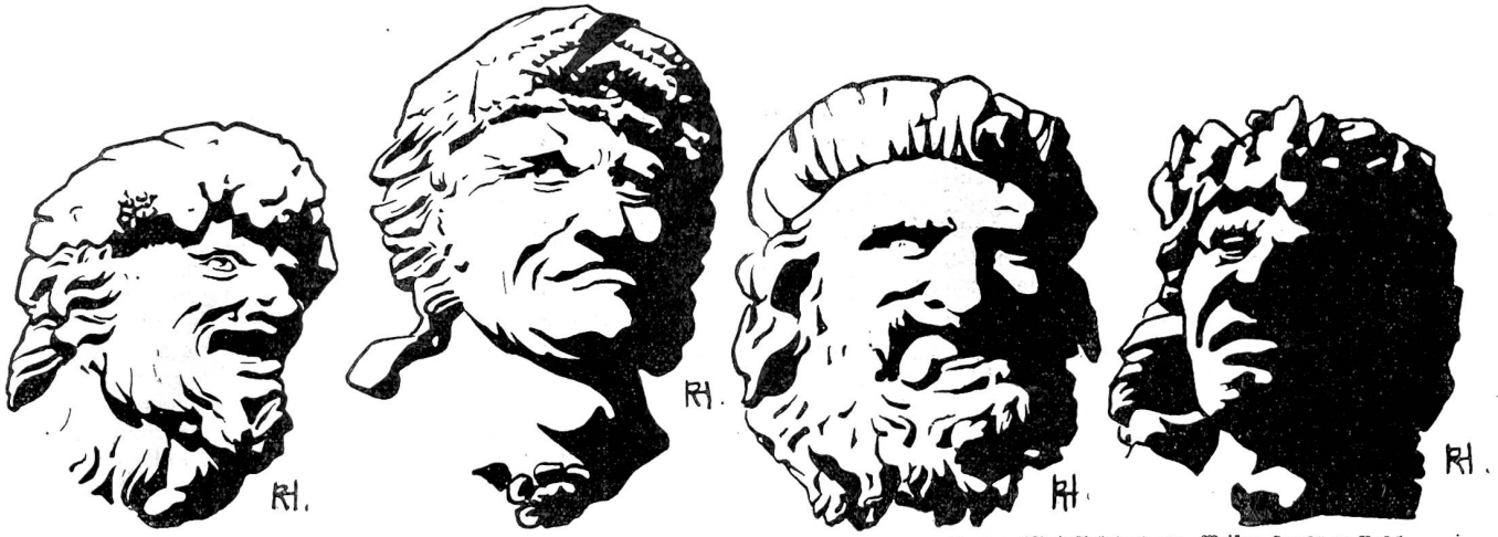
Frazen (Steinskulptur) am „Welken Haus“ zu Basel.

zeigt, wie viele der Schemawut zum Opfer gefallen sind. Man vergegenwärtige sich nur den Bloß der Untern Realschule, wo sie durch dessen Mächtigkeit vielleicht am aufdringlichsten zutage tritt. Da unsere Schule erst eine Schöpfung des neunzehnten Jahrhunderts ist, konnte man hier nicht wie bei der Kirche an historischen Stilen zehren, und so kam man denn zum Unsehen unzähliger Landschafts- und Straßenbilder vom Norden bis zum Süden Europas und Amerikas, zu jenem schematisch-formlosen Schulhauskasten mit oder ohne Turm, dessen Oede man wohl nicht leugnen konnte, aber eben mit dem Mäntelchen von den hygienischen Forderungen zudeckte... Wie fein gliedert hier der Mittelbau (s. Abb. 10) die ganze Anlage! Wie harmonisch ist die eine große Masse in eine Gebäudegruppe aufgelöst! Aus diesem Bau tönt uns nicht mehr die farblose Internationale entgegen, sondern er ist bodenständig und kann uns davon überzeugen, daß er nur für diesen Platz geschaffen ist und daß Basler Blut in seinen Quadern rollt*).