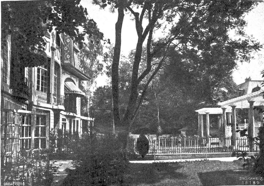
Moderne Architektur in Basel Abb. 6. Aus dem Garten der Dreihäusergruppe S. 84 (Arch. Rudolf Lindber, Basel).

machen," sagte sie hart, „ich will dir helfen zum Erfolg! An mir soll es nicht fehlen. Aber zu mir kommen mußt du wieder. Mich nicht so erbarmungswürdig alleine lassen in all der Not!“ Noch einmal entrang sich ihrer Kehle kurz und stoßend das dumpe Schluchzen.