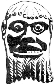
Solksfrazen von der Basler Münsterbestuhlung.