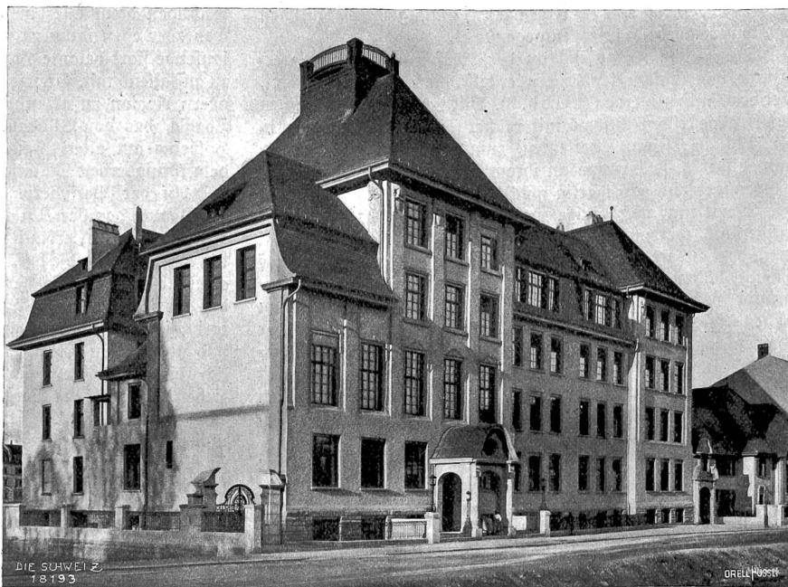
Moderne Architektur in Basel Abb. 10. Schulhaus an der Anselstraße (Arch. Hochbaupinspektor Günernwabel, Basel).