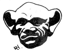
Frage am Spalentor in Basel.