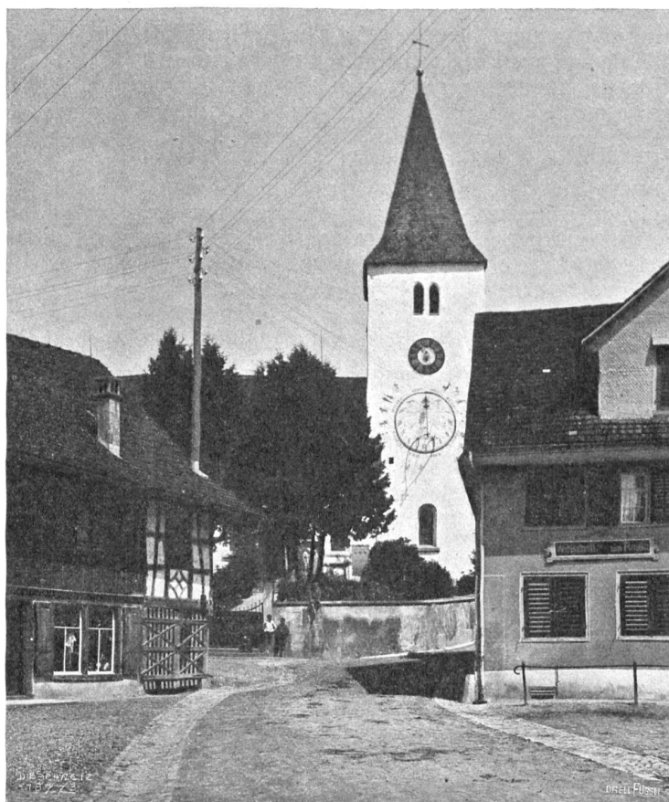
Märktetten im Thurgau. Dorfplatz mit Kirche.