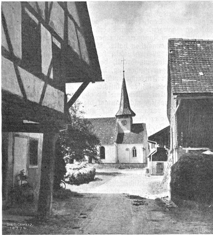
Aus Felben im Thurgau.

gern noch einmal geredet. Es war ihr jetzt, als hätte sie wer weiß wieviel Rat von der besonnenen Altersgenossin empfangen können. Doch die Hanna war ja heut mit ihrem Hochzeiter nach Fehrenberg hinüber auf Verwandtenbesuch gefahren . . .