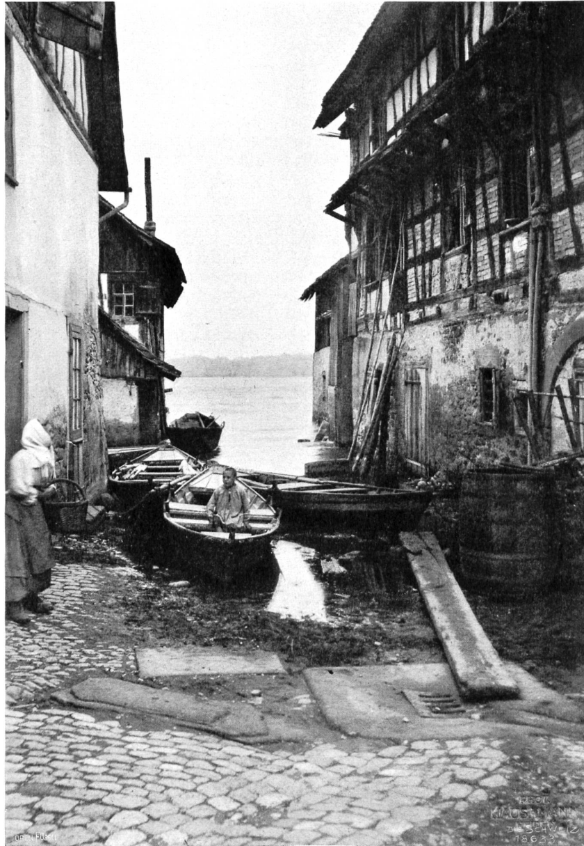
Häusergruppe in Berlingen.