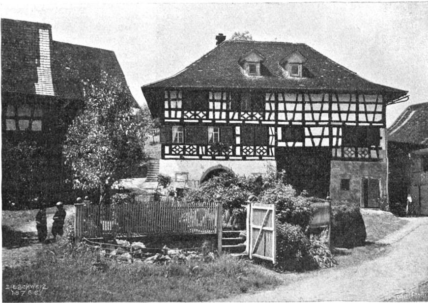
Hus Amlikon im Thurgau. Kegelhaus mit Baumgärtchen.

Diese Improvisationen — denn schließlich ist jede Karikatur eine solche — waren so reizvoll und geistreich ausgeführt, daß es der berühmten Namen darunter nicht bedurfte hätte, um mir zu verraten, daß die Urheber Meister ihres Faches. Gerade der Mut, das Fabelhafte und Lächerliche zu verewigen, ist der wahre Mutwille des Künstlers, der seine Einfälle festspielt wie den flüchtigen Schmetterling auf der Nadel.