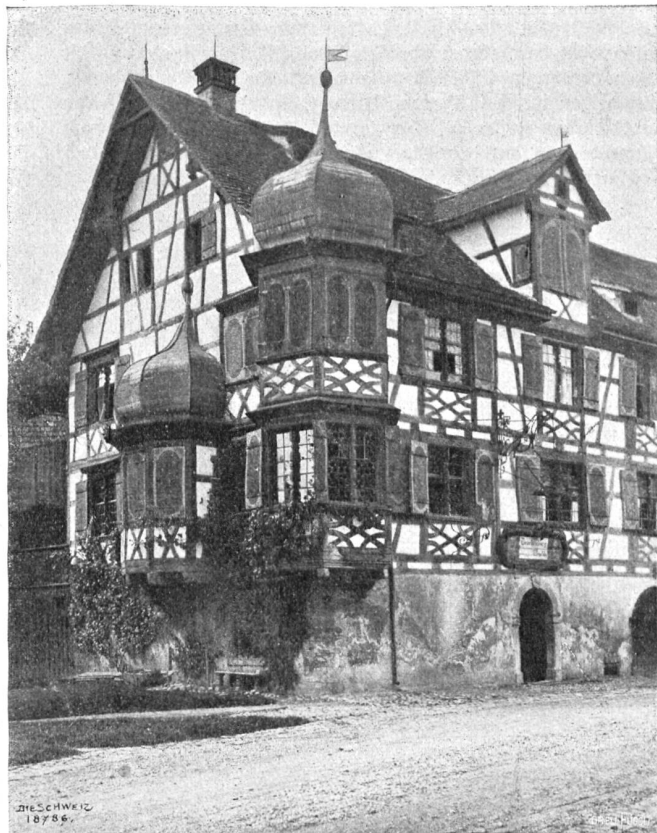
«Drachenburg» zu Gottlieben im Thurgau.

glaubte man, er diktire ein Todesurteil, und wenn er um Feuer bat, so meinte man, Wallenstein beschwöre Max Piccolomini. Er war gerade dabei zu erzählen, wie er, ein blutjunger Anfänger in Dresden, für den erkrankten Devrient als Othello habe einspringen müssen und so hinreißend gespielt, daß das Publikum nichts von der Stellvertretung