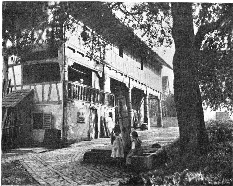
Haus Keshwil im Thurgau. Bauernhaus mit Säulenbau.

um, es baut auf, und wenn dann die andern, die Talentlosen, vor Reid umfallen, dann heißt es, es habe sie umgeworfen, das stimmt aber nicht! Es baut auf, und zwar auf dem alten Fundament, dem goldenen Boden des Handwerks; denn ohne die Arbeit, die rein mechanische, niederträchtige, schweißtriefende Arbeit, gibt es keine Kunst, die Kunst indes ist die Jakobsleiter, die von der dunkeln Erde hinaufführt zu den goldenen Sternen. Wir sollten die alte Zeit loben statt sie zu schmähen und zu entwerten! Die realen Werte können wechseln, die idealen nicht. Wert bleibt immer das, was man gern haben möchte und nicht kriegt, was man ausführen sollte und nicht kann, das schwer Erreichbare, das Langersehnte, das Heißbetene, das mit dem