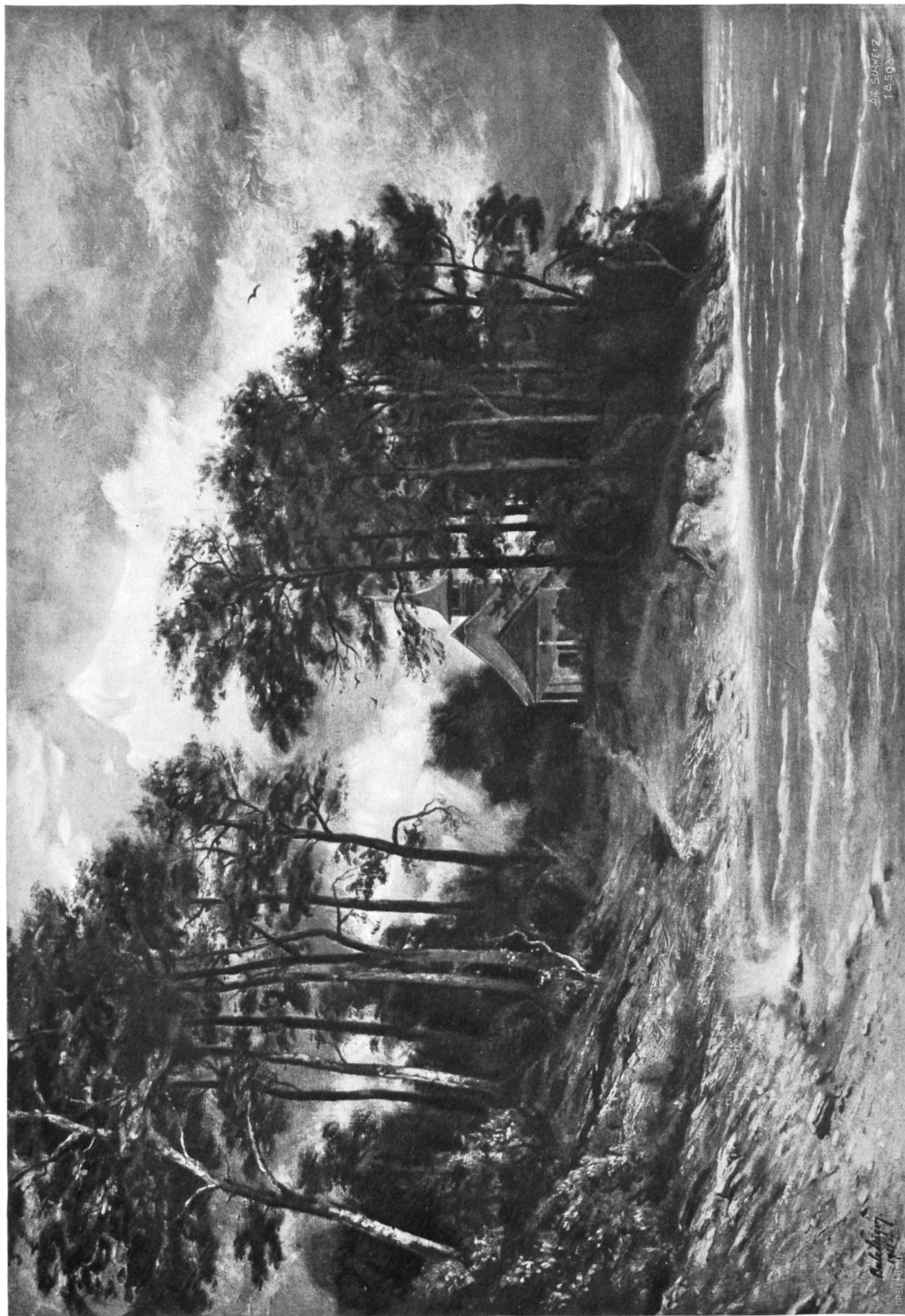
Bald Säger, Zürich.