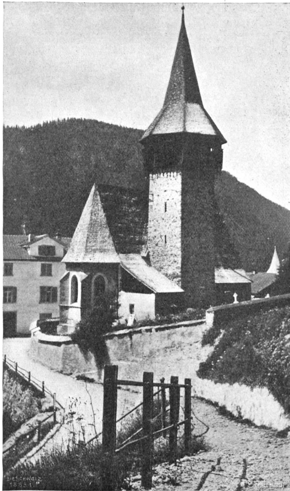
Das Kirchlein von Langwies im Schanfigg.

Pauli brachte es nachher kaum über sich, Hermine von dem Zusammentreffen etwas zu sagen.