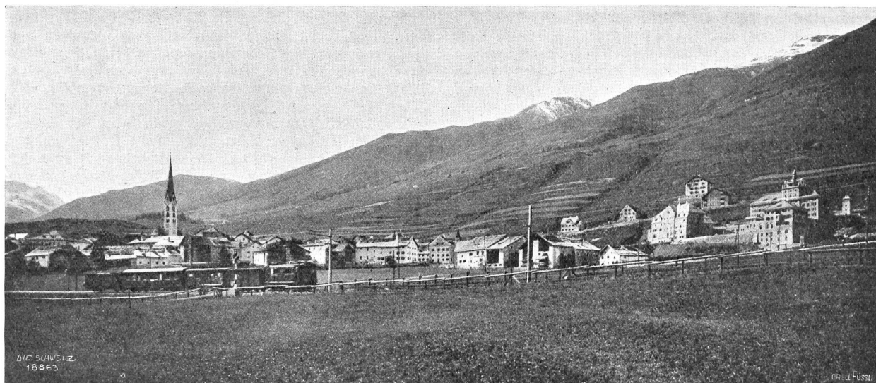
Zuoz von Ofen, rechts die Gebäudegruppe des Lyceums „Engiadina“.

Es ist kein Zweifel, daß diese Erziehungsanstalt für die ganze Gegend Anregung aller Art gebracht hat. Die akademischen Ferienkurse, die diesen Sommer in Zuoz abgehalten