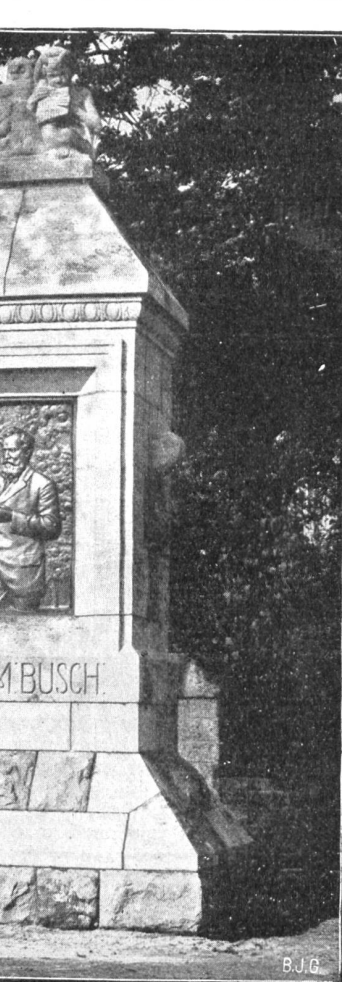
Das Wilhelm Busch-Denkmal in Wiedensahl.

Im obern Teil der Ruhmeshalle reiten 324 gleichgebildete Reiterfiguren in elf Reihen übereinander um die Kuppelwölbung herum. Sie sind der einzige Schmuck des Denkmals, der in Beton gebildet ist. Am Oberbau des Denkmals stehen außen zwölf Kriegergestalten von je 12 Meter Höhe; jeder dieser „Wächter der Freiheit“ wiegt über 4000 Zentner, ein Fuß etwa 50 Zentner, jeder Kopf ist 1,60 Meter hoch. Den Abschluß des Ganzen bildet eine gigantische, aus 120 Werkstücken hergestellte, quadratische Deckplatte von 10,6 Meter Seitenlänge und 3,6 Meter Höhe. In diesen riesenhaften Maße n, die sonst nur von den Pyramiden des Altertums und den Bauten orientalischer Herrscher erreicht werden, wird das Völkerschlachtdenkmal auf den blutgetränkten Gefilden auf Jahrhunderte hinaus von der Wiedergeburt des deutschen Volkes zeugen.