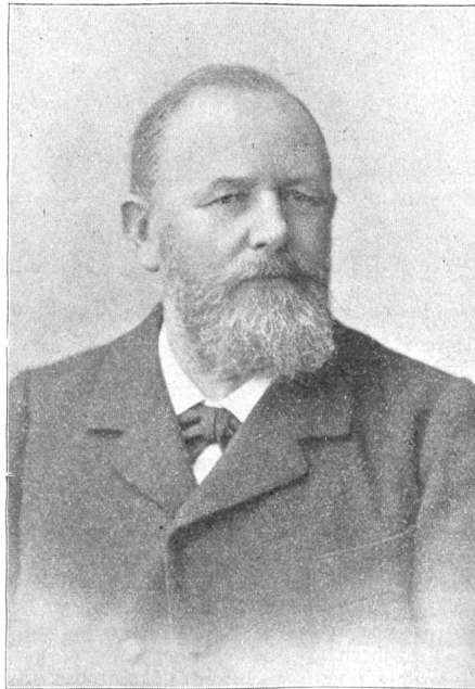
† Alt-Nationalrat Oberst Emil Moser (1837—1913).

Die Denkmalfeier in Leipzig vollzog sich in dem üblichen Rahmen, hinter einem für das große Publikum undurchdringlichen Schleier von Wachmannschaften, die die 29 Fürsten vor allen Gefahren zu schützen hatten. Eine tiefer gehende Anteilnahme der großen Massen an der Erinnerungsfeier scheint denn auch nirgends hervorgetreten zu sein.