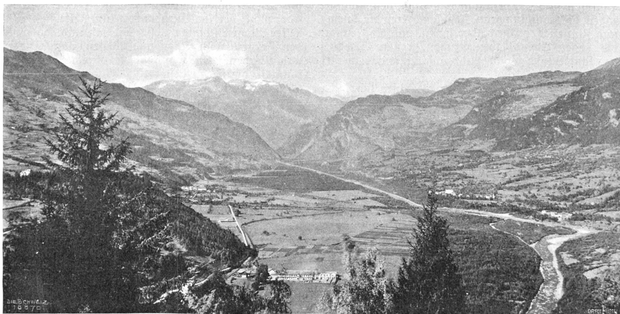
Das Domleithg von Bohenrätien aus.