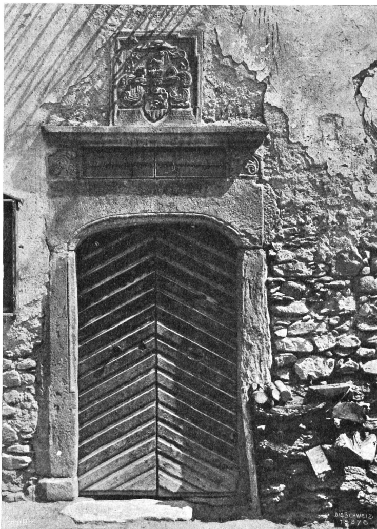
Baustor in Tomils (Domleischg).

Was ging ihn das Gerede der andern an? Er wußte es besser und hatte seine guten Gründe, seine Weisheit nicht un-