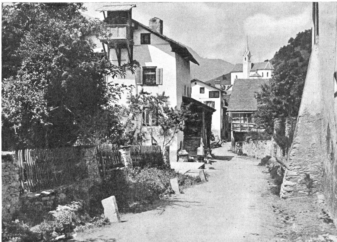
Tomils im Domlechg.

marie kniff die schmerzenden Augen zu und ließ sich auf einen Stuhl dicht am Fenster nieder. Sie suchte in ihrem Gedächtnis nach Zusammenhängen. Da draußen leuchtete der Morgen sonnig und golden. Aber es schien ihr, sie habe schwarze Gläser vor den Augen und das Greifbarste sei in weite Ferne gerückt. Dann erinnerte sie sich. Erst an die Begegnung mit dem Sigriften, dann an Jochem, an — die Nacht, den Abschied, die Träume ... Jäh zuckte sie, wie von einem Peitschenhieb getroffen, zusammen: „Das Mareiengrab!“