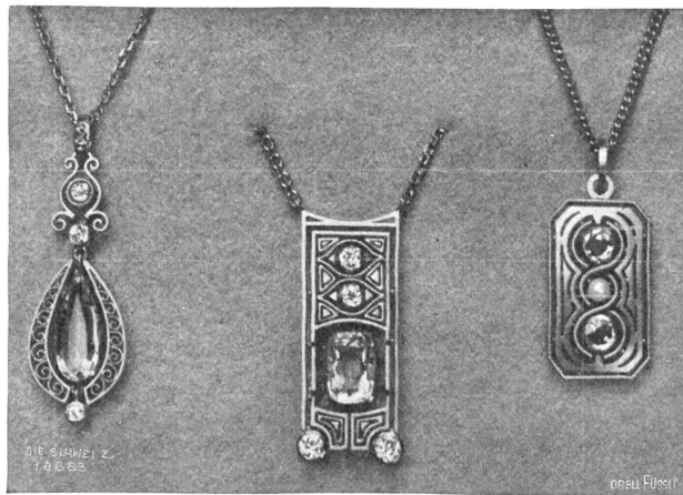
Ernst G. Stäheli, Frauenfeld. Abb. 2. Anhänger in Mattgold: a) aus glattem und gefertigtem Golddraht mit Spiralornament (tropfenförm. Aquamarin, 3 Brillanten, Fassung Platin); b) aus glattem und gefertigtem Golddraht mit Dreieck-Linieneinführung (viereckiger Aquamarin, 4 Brillanten, Fassung Gold); c) aus gefertigtem Golddraht, Fassung Goldblech mit à jour-Ornament (2 Saphire, 1 Perle).

mit gleichzeitiger Belegung von Kursen im Zeichnen und Modellieren. Nach Erledigung der Lehrzeit kam er für ein Jahr zu Ponti-Gennari nach Genf, wo er Gelegenheit fand, sich im Entwerfen und Modellieren auszubilden. Unter Eugen Dufler in Firma Bossart & Cie. in Zürich wurde er in die Juwelenausscherei eingeführt. Eine einjährige Etappe bei Ponti-Gennari (Zweiggeschäft von Genf) in Paris verschaffte ihm nicht nur Gelegenheit, selbständig entwerfen und ausführen zu können, er lernte auch die Arbeiten der Pariser Meister, eines Fouquet, Boucheron, Bever und Lalique kennen. Ein fünfjähriger Aufenthalt in Dresden beim Gravier- und Zeichenlehrer Robert Neubert sowie die Belegung eines Kurses über Steinkunde am geologischen Institut in Bern vervollständigten sein Studium. 1912 zog Ernst G. Stäheli wieder in seine Vaterstadt zurück. Seit dieser Zeit ist er bestrebt, seine Ideale zu verwirklichen. Viele gute Erzeugnisse sprechen für sein Wissen und Können, sie kom-