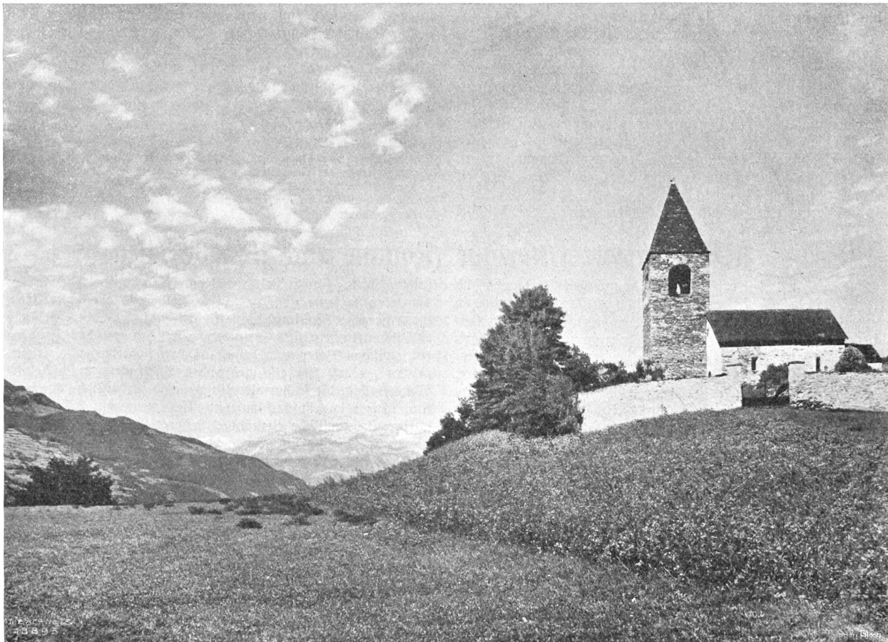
Kapelle St. Cass(i)an (im Domleschg) mit Ringelspiz (3251 m).

Eine ganz andere Sache ist es mit den mittelschwer Erkrankten, bei denen schwere Allgemeinerkrankungen (Lungenentzündung, Typhus, Infektionen, Influenza) oder intensivste Arbeit ohne Ausspannung und langdauernde Gemütsaufregungen das Nervensystem erschütterten. Da ist es mit einer Ruhezeit von zehn bis vierzehn Tagen nicht getan, das ist nur schlechte Flickarbeit. Eine Heilung oder wesentliche Besserung ist da nur von einem mehrmonatlichen Aufenthalte zu erwarten. Auch ergibt der Grad der Erkrankung sofort, daß der Faktor Ruhe ganz in den Vordergrund und der Faktor Sport mehr oder ganz in den Hintergrund tritt. Ja, es besteht zweifellos jetzt schon das dringende Bedürfnis, daß neben Sporthotels, die abends oft bis gen Mitternacht lärmig sind, einfachere Häuser mit der speziellen Bestimmung zur Aufnahme von ruhebedürftigen Kranken auch im Winter an allen Höhenkurorten geöffnet würden. Daß da besonders auch für sorgfältig zubereitete einfache oder wechselnde Kost mit Einschränkung der Fleischzufuhr gesorgt werde, ist immer noch bloß ein Wunsch, der hoffentlich aber bald realisiert wird. Der Pensionsbesitzer an günstigen Höhenorte wird rasch ein volles Haus haben. Ueberhaupt ist die Regulierung der Diät an Kurorten eine offene Frage, deren Lösung schon vor etwa zehn Jahren umsonst von der Balneologischen Gesellschaft Schweiz, Merzte in einer Konferenz mit den Herren Hoteliers versucht wurde im Sinne einer Vereinfachung der Menus, einer Herab-