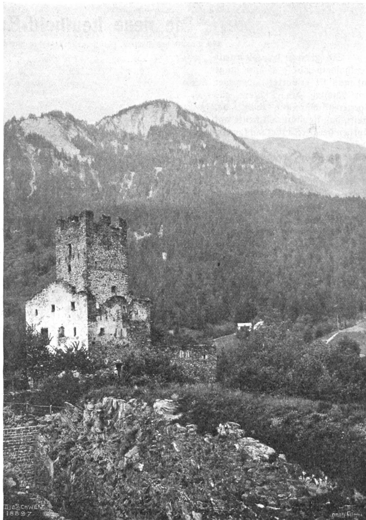
Burguine Campi (770 m) am l. Ufer der Albula (an der Schyntrabe), Stammsschloß der Familie Campi (Campo bello).

Wenn ich hier Carl Friedrich Wiegands schönes Buch