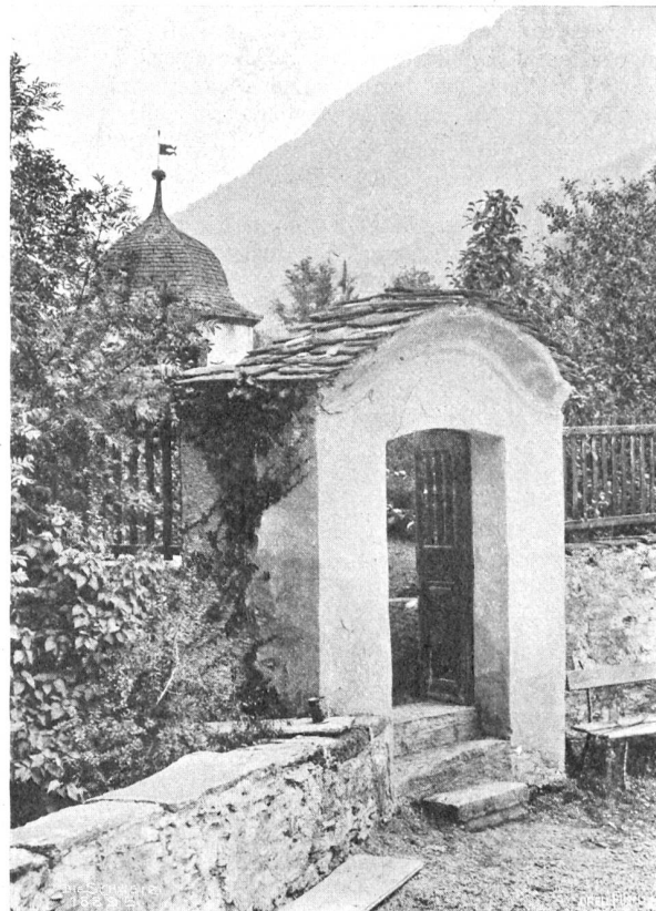
Motiv aus Schloß Baldenstein im Domleschg.