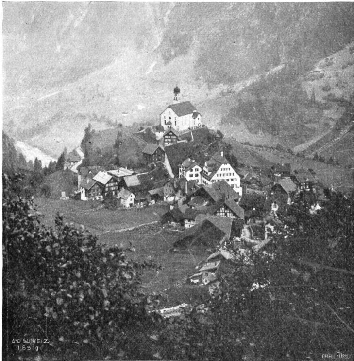
Gebrüder Pflister, Zürich. Gasthof Ochsen und Post Waffeln im Gesamtbild des Dorfes.

In der Frühe des folgenden Tages begann Aghions Arbeit. Es erschien und wurde ihm von Bradley vorgestellt der schöne dunkeläugige Jüngling Vhardenna, der sein Lehrmeister in der Hindostani-Sprache werden sollte. Der lächelnde junge Indier sprach nicht übel englisch und hatte die