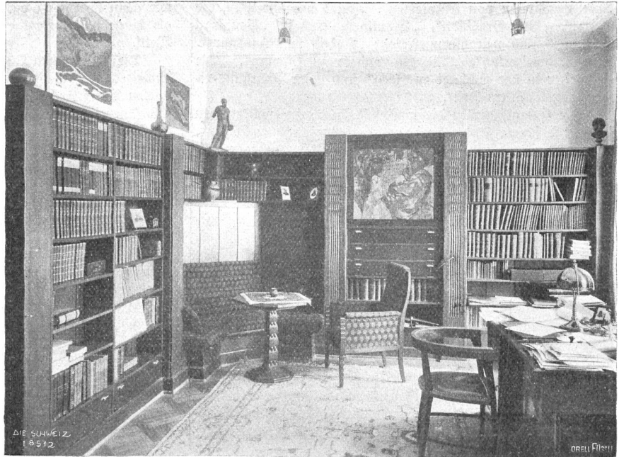
Armin Witmer-Karrer, Zürich.

„Ich weiß,“ sagte sie verlegen und leise. „Und wenn ich befehle ... langsam zu fahren...“