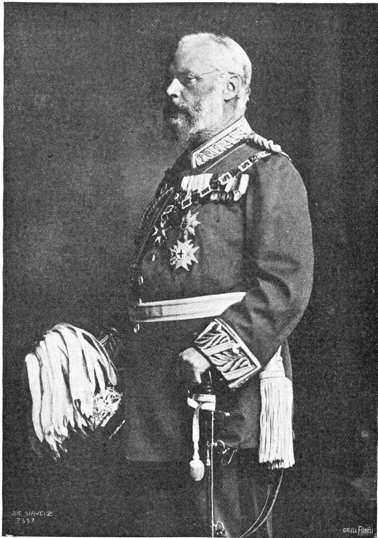
Prinzregent Ludwig von Bayern.

mit den übrigen Verbündeten, denen es besser diente, wenn die griechische Flotte die Aufsicht über die Seezufahrten von Anatolien her behielt und die Feindseligkeiten fortsetzte, um die Türkei auch während des Waffenstillstandes zu beschäftigen und die Vorbereitung zu einer erfolgreichen Fortsetzung des Krieges zu verummöglichen. Gleichwohl gingen aber auch griechische Unterhändler nach London, wo sich freilich die Türken sträubten, mit ihnen zu verhandeln, dann hiefür erst neue Instruktionen aus Konstantinopel einholten, was den Gang der Geschäfte nicht wenig verlangsamte. Den Ehrenvorsitz in der Friedenskonferenz führt der englische Minister des Aeußern, Sir Eduard Gren; das Tagespräsidium hat abwechselnd eine der beteiligten Delegationen inne. Gleichzeitig mit den Friedensunterhändlern tagten in London die Botschafter der sechs Großmächte. Aller noch drohenden Schwierigkeiten ungeachtet,