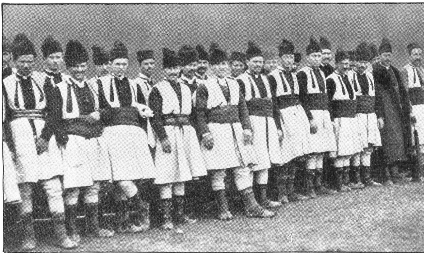
Serbische Bauern als Reservisten.

Albanien. Staatengebilde geben, wenn etwa aus den griechisch-serbisch-bulgarischen Rivalitäten noch ein „autonomes Makedonien“ hervorgehen sollte. Das wäre kein übler Witz der Weltgeschichte, bestrübend ist nur, daß ihn so viele Tausende mit ihrem Gut und Blut bezahlen mußten. Ueber die Motive und die Durchführung des Krieges der christlichen Balkanstaaten gegen