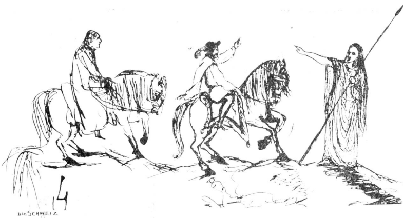
Aus J. V. Widmann's Skizzenbüchern.

Herz unter italienischen Gassenbuben und Lazzaroni auf! Wie traf er den Ton mit den einfachsten Bewohnern unserer Alpenländer! Mit welcher ehrfurchtsvollem Staunen betrachtet er die naiven ländlichen Schönen, die am Sonntag auf dem Marktplatz von Bologna vorüberziehen! Sie geben ihm in ihrer unverdorbenen, warmen Sinnlichkeit eine Ahnung von der Seligkeit Gottes, durch dessen Wesen Millionen solcher Lebensströme ein- und ausfluten. Und ist es nicht bezeichnend für Widmann, daß die einzige Träne, die er in seinen Gedichten und wohl überhaupt in seinen Werken eingesteht, seiner armen, in der Zimmerluft dahinstorbenden Palme gilt?