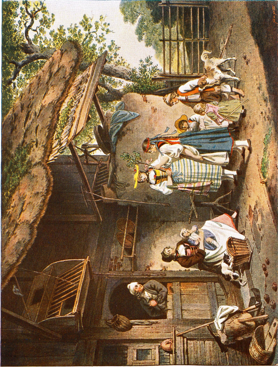
Sigmund Freudenberg (1745—1801).