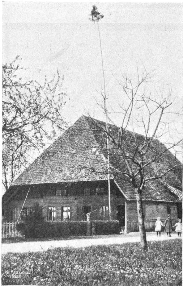
«Maibaum» im Bernbiet, wie er noch heute in der Nacht auf den 1. Mai von den Jungburschen des Dorfes einem beliebten Mädchen vors Fenster gepflanzt wird.

Wir schließen unsere Betrachtung mit der Erwähnung eines schönen kirchlichen Brauches, der aber tief in der Volks-