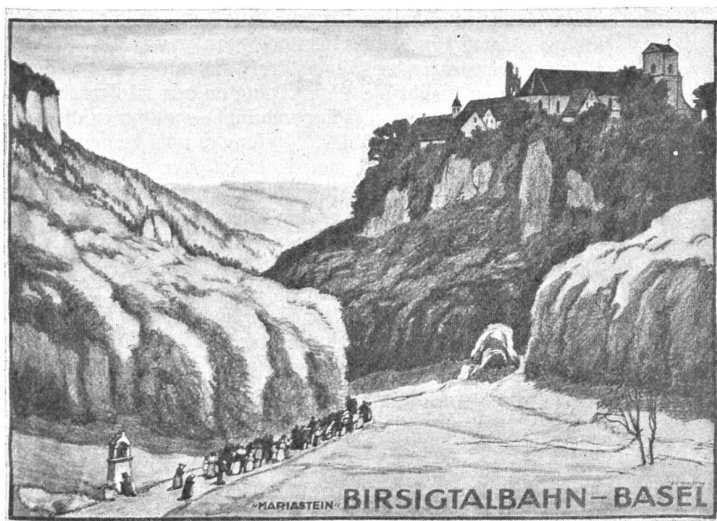
Ernst Emil Schlatter , Zürich. Plakat für die Birsigtalbahn. Druck: Graph. Anstalt J. C. Wolfensberger, Zürich.