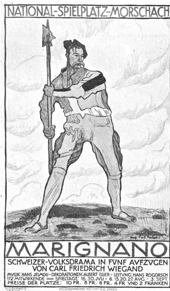
Ernst Würtenberger, Zürich. Plakat für die Marnignano-Aufführungen in Morschach (1911). Druck: Polygraphisches Institut A. G., Zürich.

Ich lebe; aber in mir innen ist viel erstorben. Viel — ich weiß nicht, was alles es ist. Dafür habe ich keine Worte . . .