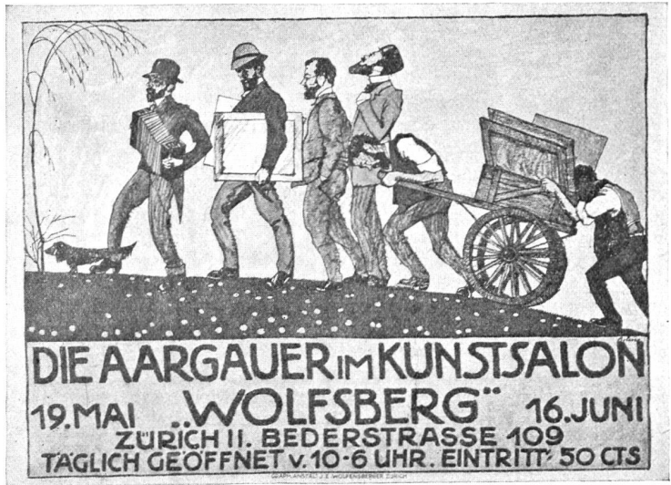
Ernst Bolens, Aarau. Plakat für die Ausstellung der Aargauer im „Wolfsberg“ Zürich. Druck: Graph. Anstalt J. C. Wolfensberger, Zürich.

Das Lied verweht in den silbernen Weiten, Die Rosen entschlämmern im kühlenden Licht ... Ich warte. Ich will meine Hände ausbreiten Und wach sein, daß niemand die Rosen mir bricht.