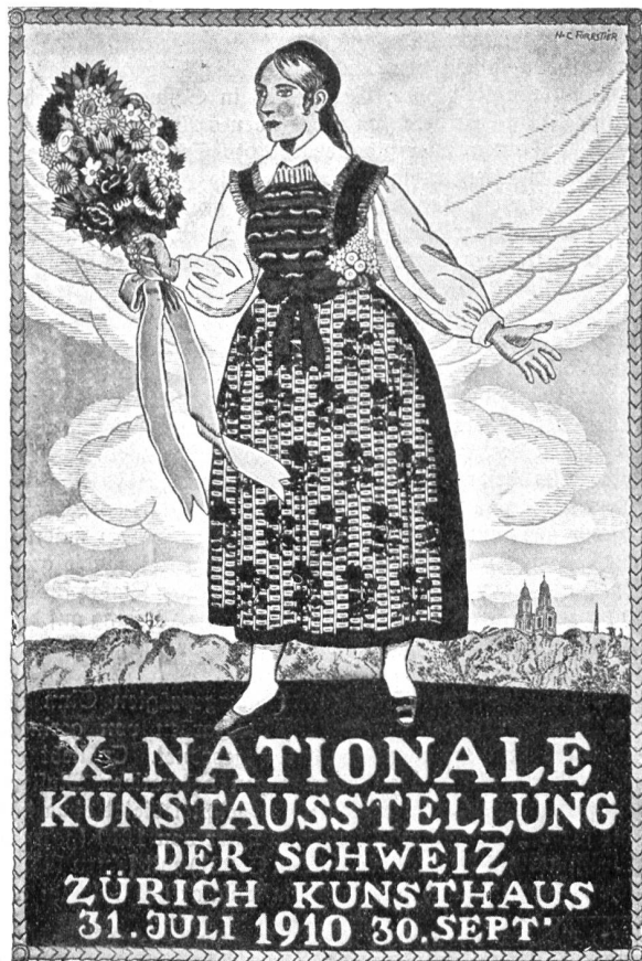
Henri Claude Foretler, Genf. Plakat für die X. Nationale Kunstausstellung der Schweiz, Zürich 1910. Druck: Graph. Anstalt J. E. Wolfensberger, Zürich.