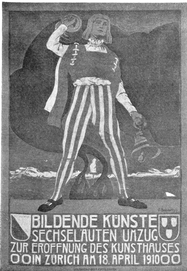
Fritz Boscovits, Zürich. Sechseläutenplakat 1910. Druck: Graphische Werkstätten Gebr. Frey, Zürich.

„Schminktöpfe, Enna, Perücken, Masken, allerlei Gewand!“