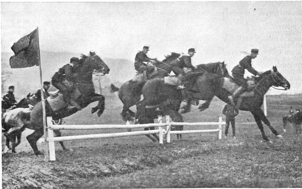
Hürdensprung in einem Wettrennen der Zürcher Kavallerie-Reservenschule.

* So hat denn Oskar Bider, der Pyrenäenüberflieger, auch die Berner Alpen bezwungen. Der gefeiertste und erfolgreichste Schweizer Pilot, der Liebling der Bundesstadt und ihre tägliche Freude, hat Dienstag den 13. Mai in