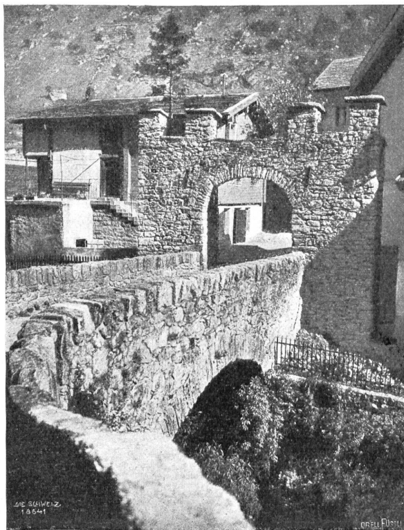
Die alte «Zollbrücke» in Göschenen.

Eine sehr erfreuliche Erscheinung, die auch an dieser Stelle erwähnt zu werden verdient, ist die zunehmende Naturbegeisterung in den Kreisen der Arbeiter. In welcher großen Maße sie vorhanden ist, erfuhr ich durch einen glücklichen Zufall. Ich hatte mich mit einem Freunde auf einer Nachtwanderung zum Säntis im Nebel verirrt, als wir in der Nähe des „Kräzerli“ an einen Zaun kamen, dessen Durchgangstor ein Schild trug: „Zur Naturfreunde-Hütte“. In der Tat gelangten wir schon nach zehn Minuten an die Hütte, in der wir zu unserer Freude noch Licht brennen sahen, obgleich es bereits tief in der Nacht war. Auf unser Klopfen wurde uns aufgetan; wenige Minuten vor uns waren ein paar andere Touristen angekommen, die sich's nun so bequem wie möglich zu machen versuchten. Niemand fragte uns nach dem Woher und Wohin, niemand nach unsern Wünschen oder gar Namen. In einem