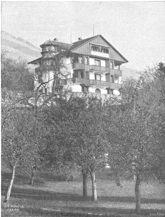
Theiler &amp; Selber, Luzern.