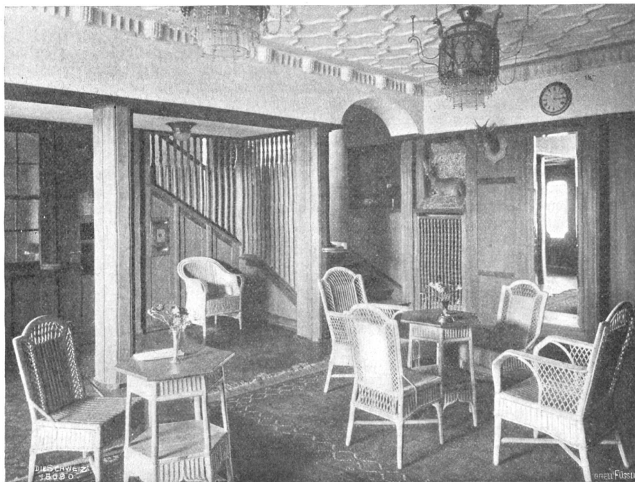
Theiler &amp; Belber, Luzern.