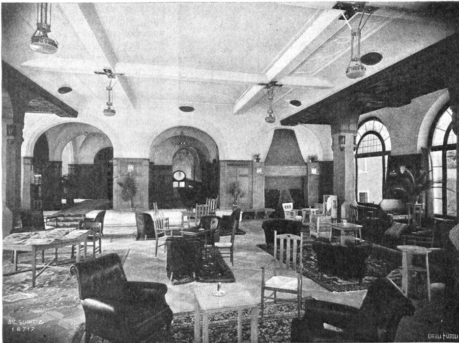
Arnold Huber, Zürich. Palace-Hotel in Pontresina. Blick von der Halle zur Entree (links) und in den Korridor zum Speisesaal. (Täfer sowie Pfeiler, Decken der Seitenpartien und Boden in Eichenholz; in den Fenstern große Spiegelscheiben wegen der Aussicht, kleinere Seitenflügel zum Öffnen).

Schneedecke lag, steht jetzt zwischen blattlosem Gebüsch ein gelbes und blaues Blütenmeer. Und im Spätjahr, wenn von Baum und Busch das Laubwerk fällt, ersteht in den gemähten Wiesen die feierliche Schar der Herbstzeitlosen, an die das Volk eine dunkle Sage geknüpft hat. Wenn die ersten unter ihnen die Köpfe recken, sehen die Herbstnebel ein.