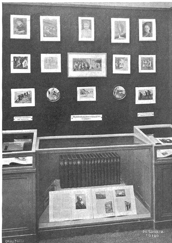
«Die Schweiz» an der Internationalen Ausstellung für Buchgewerbe und Graphik in Leipzig.

Stereotypen und Galvanos, besonders aber die Holzsotypen (z. B. Roman Scherer A.-G. Luzern), und im Akzidenz- und Illustrationsdruck reicht die Schweiz jeder Konkurrenz das Wasser. „Was ist das: Blütenpracht im Mai? Mit einem Vierfarbendruck ist sie erschöpft!“ Ein grausames Wikwort, ein Poesiemörder, und doch kann man sich eines gelinden Nachschöpfergefühls, das sich bei dem Mattdruck ins Herz stiehlt, jedes Bild ein Widerhaken, nicht erwehren. Der Schrecken des Frühstückstisches, die Drucksachen, zeigen sich von ihrer schönsten Seite; die Buchdruckerei Berchtlihaus, Zürich, Neukomm & Zimmermann, Bern (Wertpapiere), Benziger & Cie., Einsiedeln, um nur einige Namen zu nennen, kann man hier nicht übersehen.