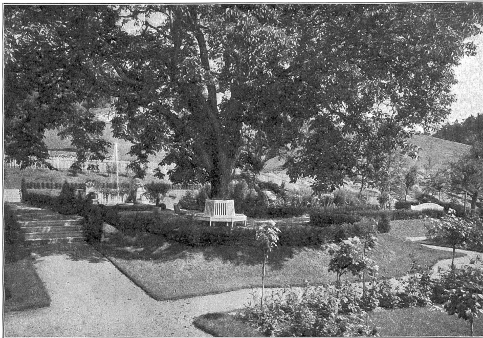
Gartenkunst. Aus dem Garten Langrain in Thun. Der alte prachtvolle Buchsbaum mit weit ausladenden Ästen wurde zum Mittelpunkt des neuen Gartens gemacht; auf dem mit Buchsbaum eingefassten Plätzchen ist um den Stamm eine weiße Bank gebaut, von wo aus der Blick über den Rosengarten und den Thunersee schweift. Entwurf und Ausführung von Ditto Froebel's Erben, Zürich.