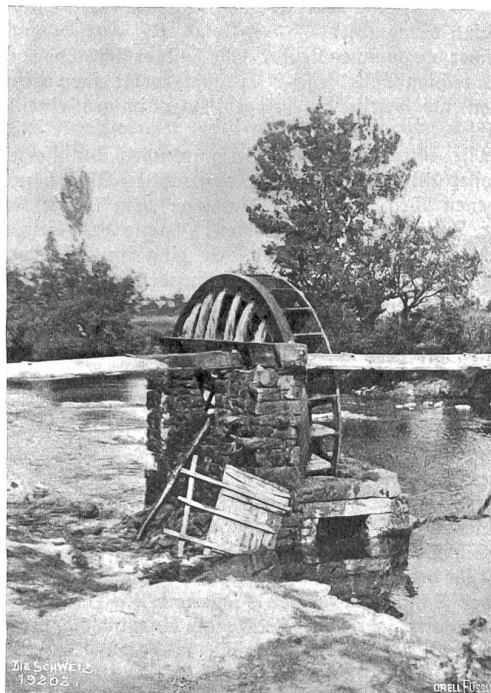
Wallerrad in der Herzegowina.

Von Scham und Reue gepetit und von der Wut über seinen ungebändigten Jähzorn ganz zerknirscht, ging Schlosser Uli heim. Zwei Stunden später schrieb er einen Brief an Nina. Er schrieb ihr, daß er nun nie mehr in ihres Onkels Barackenwirtschaft kommen werde. Nicht seinetwegen, aber ihretwegen müsse er es tun. Denn man könne den Leuten die Mäuler nicht verbinden; das habe er erst heute nachmittag