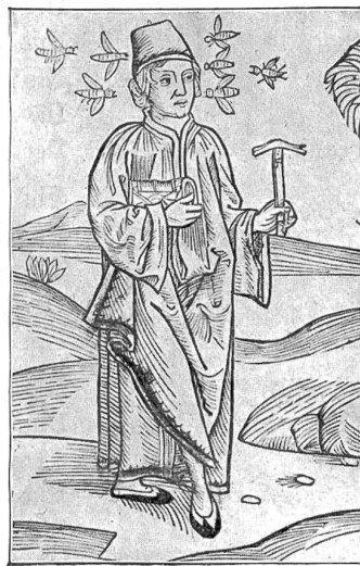
Felix Hemmerlin (1389–ca. 1460), ein frühester Gewährsmann für die Geschichte des Pilatus.

Nur noch Xaver Imfeld sei erwähnt, der schon als Industrieschüler in Luzern im Jahre 1870 ein Pilatusrelief im Maßstabe 1:50,000 hergestellt hatte und in Zürich als letzte und vollendetste Arbeit im Jahre 1909 das Relief im Maßstabe 1:25,000 hinterließ. Eines im Maßstabe 1:10,000 blieb unvollendet. Dagegen exi-