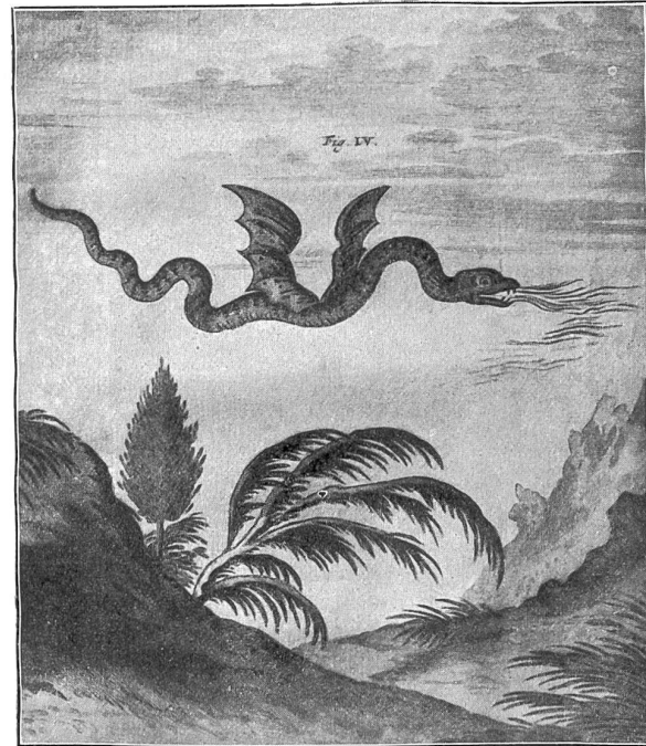
Der Pilatus und seine Geschichte. Der angebliche Pilatusdrache (nach Johann Jacob Scheuchzer).

Zwei Bauern, ein echter Landsknechtstyp und ein etwas schwermütiger Bayer, reisen nach Offenburg mit dem ersten Schnellzug zwischen München und Frankfurt, der nach der Mobilmachung wieder verkehrt. Es sind zwei wackere Landstürmler. „Wir haben bis Mittag auf dem Feld gearbeitet, dann sind wir zwei Stunden zu Fuß nach der Bahn gegangen, um dem Ruf des Vaterlandes zu folgen.“ Sie sitzen ruhig und vertrauensvoll mit den ärmlichen Köfferchen zwischen den Beinen und reden erfreut von ihrer Tätigkeit. „Tag und Nacht gab's zu arbeiten zu Haus; jetzt sind die Felder besorgt, die Ernte gut eingebracht, Frau und Kinder machen die neue Aussaat. Alles wurde bedacht. Deutschland soll in diesem und im nächsten Jahr keinen Hunger leiden. Jetzt stehen wir zur Verfügung der Obrigkeit, und wir haben geschworen für Gott und König. Für Gott und König werden wir leben und sterben.“ Das Landsknechtstypvorbild ist Junggeselle. Er deutet auf seine Reisetasche: „Die ist schon mit zur Rekrutenschule gewandert, nun war sie lange Zeit unbenutzt; jetzt hab ich sie wieder hergenommen, sie soll mich auf meinem letzten Gang zu den Fahnen begleiten.“