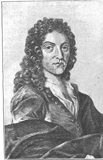
Johann Jacob Scheuchzer (1672—1733), der berühmte Arzt, Naturforscher und Alpenkundige.

Der Schaffner pfeift; der Zug setzt sich in Bewegung; die vaterländischen Lieder schallen mächtig in der Bahnhofshalle, alle Schmerzen übertönend. Die Frauen bleiben zurück, Hoffnung oder Sorge und Leid im Herzen, mit wehendem Taschentuch und feuchten Augen.