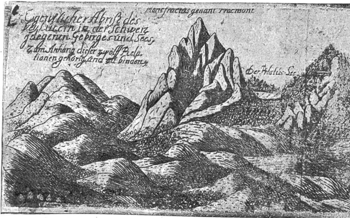
Der Pilatus und seine Geschichte. Abbildung von Pilatus und Pilatussee aus dem Jahre 1677.

stieren von Imfeld im weitem mehrere Panoramen von Pilatusgipfeln.