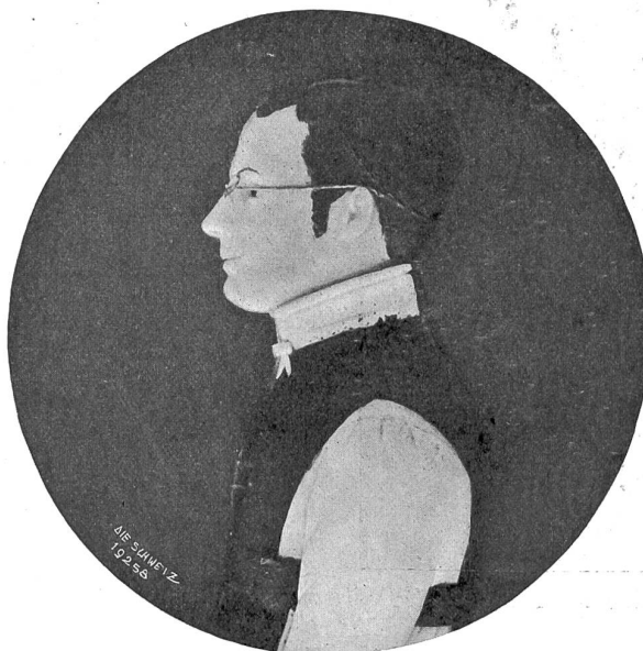
P. Alberik Zwysfig (1808—1854), der Komponist des „Schweizerpsalm“.