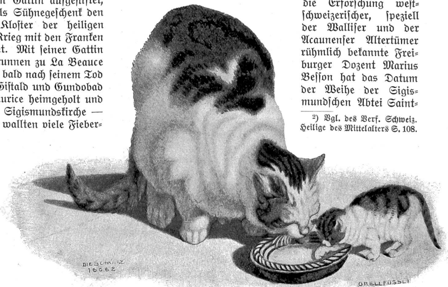
Gottfried Mind (1768–1814).