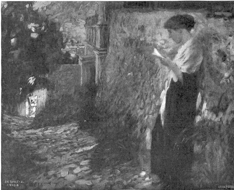
Pietro Chiesa, Sogno-Mailand.