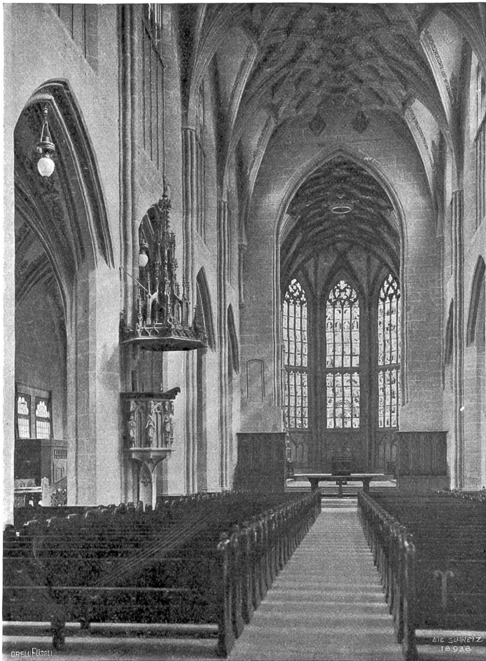
Aus dem Innern des Berner Münsters. Blick in den Chor.

aber, bereits seiner Nacktheit bewußt, die Blöße deckend, klagt: „I hab dinem rat gevolt an not: Ist menschlich gschlecht verfelt in tod“, und aus den schwer mit Früchten behangenen Zweigen grinst dieser selber auch schon: „Mß nid und haß, des Tüfels List, min gwalt in die weld komen ist.“ Ueber der Halle türmt sich ein eleganter Baldachinaufbau, vor dem, mit kaiserlichem Ornate angetan, in offensichtlichem Betrübniß der Schöpfer niederschaut. Bittende Engel sind um ihn, Gottes Rechte aber deutet nach unten und weist „vor den Garten Eden den Cherub mit einem bloßen, hauenden Schwerte, zu bewahren den Weg zu dem Baume des Lebens“.