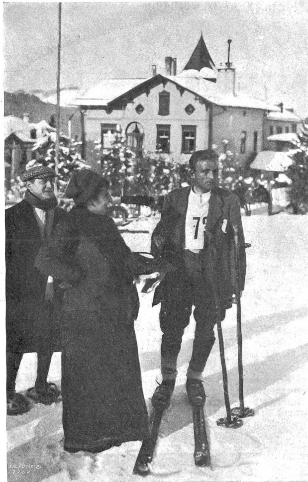
Der neue Schweizerische Skimeister für 1914, der Norweger Abbye.

* Totentafel (vom 7. bis 20. Januar 1914). Am 10. Januar starb in Genf an einem Schlaganfall Oberst Camille Fabre im Alter von 68 Jahren. Er war einer der bekanntesten und tüchtigsten Schweizer Offiziere, die sich auch schriftstellerisch betätigt haben. Seine Stellungen als Präsident des Komitees betr. Einbürgerung der Ausländer und Vizepräsident des Internationalen Komitees des Roten Kreuzes gaben ihm oft Gelegenheit, sich mit den Fragen aktueller Tagespolitik zu befassen, wobei seine Anträge und Voten stets verrieten, in wie enger Fühlung er mit dem Leben, mit seinen Mitmenschen geblieben ist und wie er stets bestrebt war, das Verhältnis zwischen Bürger und Staat unter Wahrung weitestgehender individueller Freiheit auf dem Boden des Vertrauens und der Heimatliebe immer enger, inniger zu gestalten.