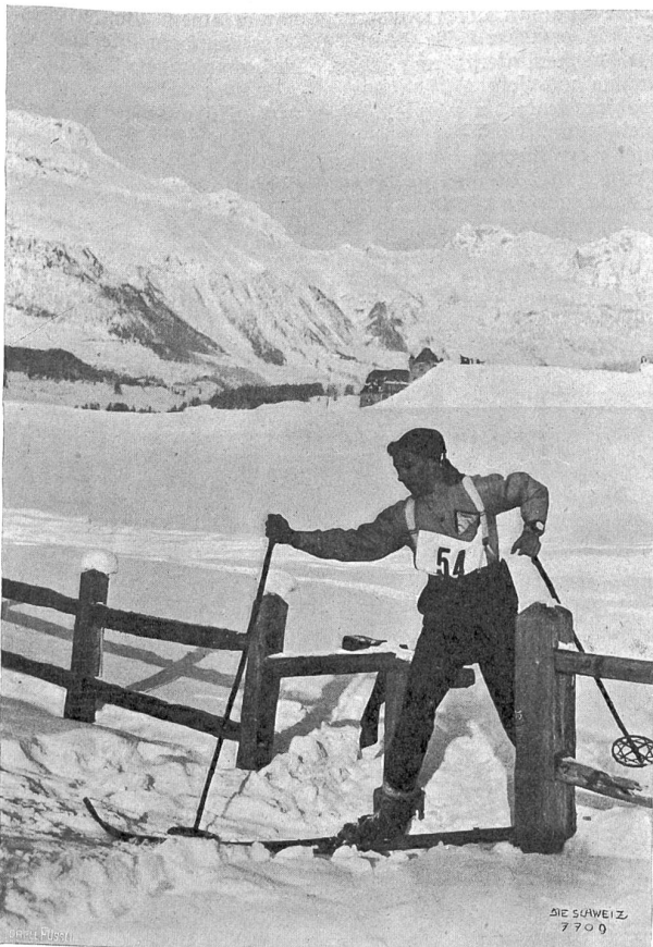
Schweiz. Skifest in Pontresina: Ein Junior beim Langlauf.