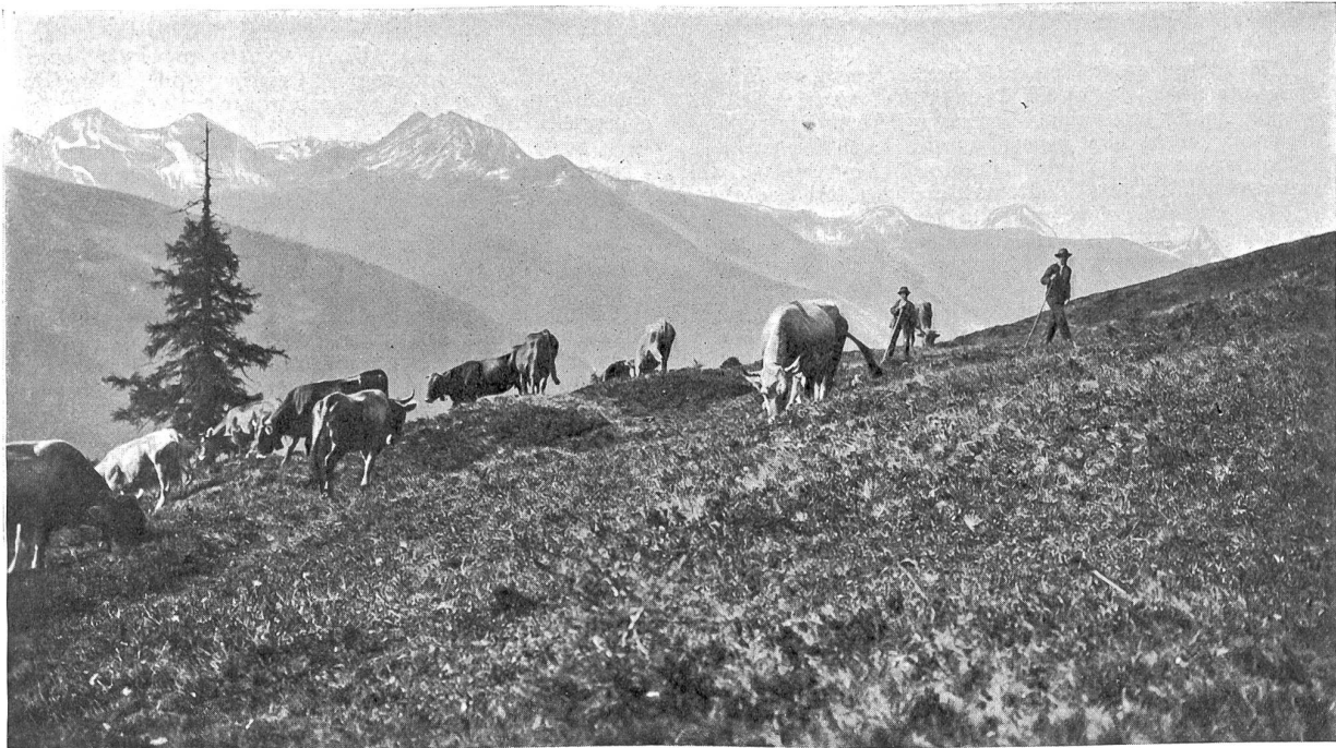
Viehherde im Gebirge.