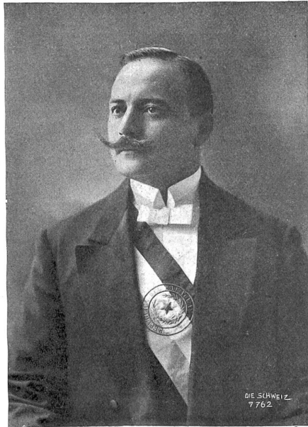
Eduardo Schaerer, der neue Präsident der Republik Paraguay.

und Agronom Professor Bertoni (ein gebürtiger Tessiner), wie denn auch durch die Sympathie, die der Präsident den Schweizern entgegenbringt, manche hervorragende Stellung im Lande durch Schweizer besetzt ist. Aber auch auf andern Gebieten wirkt Präsident Schaerer vorbildlich. Unter seiner Regide wird das Paraguay-Eisenbahnetz ausgebaut, sodaß z. B. Buenos-Aires mittelst Eisenbahn und Fährboot-Verbindung von Assuncion aus direkt innert 48 Stunden erreichbar ist; auch Telegraph und Post wurden verbessert und erweitert, elektrische Beleuchtung und Straßenbahnen und landwirtschaftliche Schulen wurden eingeführt, ebenso dem Export weitgehende Beachtung geschenkt. Schon heute steht Paraguay im Wettbewerb mit allen zivilisierten Nationen, und auch die Schweiz sollte die ihrer bedeutenden exportfähigen Industrie und Landwirtschaft gebotene Konjunktur kräftig benützen. Vertreten ist Paraguay in der Schweiz durch den umsichtigen, trefflichen Generalkonsul Franz Vogler, und Konsulate befinden sich in Genéve, Lausanne, Bern und Zürich.