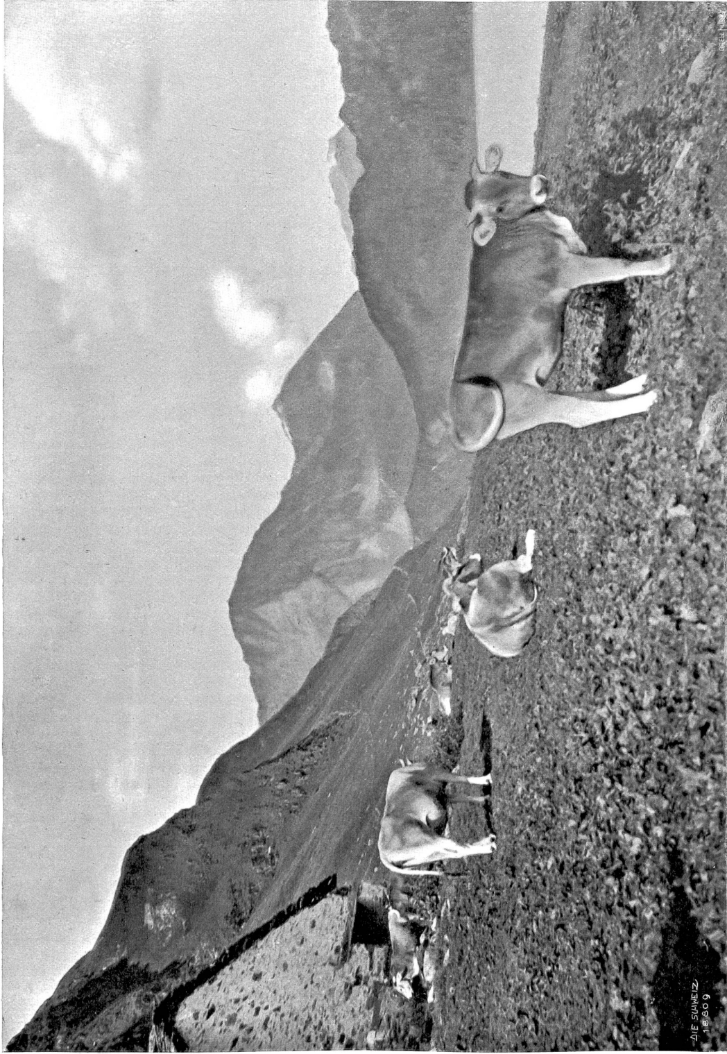
Kuhweide im Tal Piora ob dem Rifomlee.