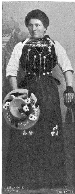
Mädchentracht um 1910 aus Schleithem, Kt. Schaffhausen.