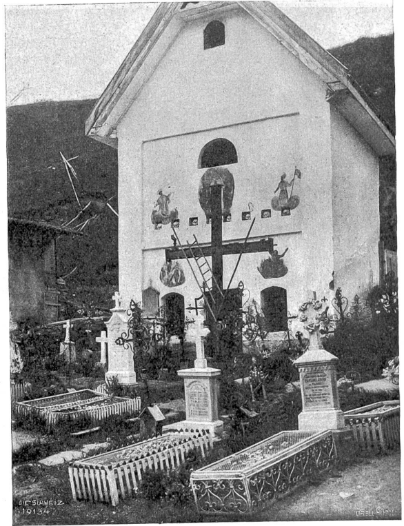
Beinhaus in Cumbels (Kungnez).

mit ihren Volksliedern die Zuhörer hoch erfreut. Einige der Mädchen hatten alte Trachten nachgeahmt und dazu die schon erwähnte „Begineklappe“ aufgesetzt, die um die Mitte des neunzehnten Jahrhunderts von allen Frauen und Kindern von früh bis spät, am Sonntag und am Werktag getragen wurde. Eine noch ältere Zeit veranschaulichten ihre Begleiter. Bis in den Anfang des neunzehnten Jahrhunderts hinein war diese Kleidung bei den Männern im Klettgau allgemein. Wenn sie zum Kirchgang oder einer andern wichtigen Angelegenheit angezogen waren, so sah der mächtige Dreimaster auf dem Kopf; vom Hemd ragte der „Vatermörder“ aus der schwarzen Halsbinde, die von einer silbernen herzförmigen Schnalle gehalten war. Schwarzgefärbte Leinwand bildete das „Ghäs“ (Kleider). Pluderhosen reichten bis zu den Knien; auch die Oberärmel des Rodes waren stark gebauscht, während die Vorderärmel glatt und eng sich dem Arme anlegten. Die Weste aus rotem Tuch hatte Silberknöpfe und wurde nicht wie sonst über die Hose getragen, sondern in diese hineingesteckt. Die Hosenträger lagen daher sichtbar auf der Weste; sie bestanden aus Leder oder Samt, und auf dem Verbindungssteg über der Brust war der Name des Eigentümers und die Jahrzahl aufgestickt.