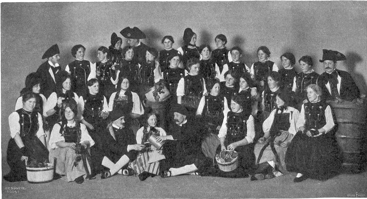
Ballauertrachten am «Röselgartefest» des Kreises Böttingen 1914.

gibt nur noch wenige, vielleicht sogar gar keine Frauen mehr, die neben der Tracht nicht auch städtische Kleider besitzen. Es ist, leider, klar, daß man die neuen, also die Sonntagskleider, nach städtischer Mode machen läßt, deshalb verschwinden die Trachten mehr und mehr. Der hauptsächlichste Grund dieses Verschwindens ist die Modesucht, dann aber auch die leichtere Beschaffung der modernen Stoffe, die überall in größter Auswahl bereit liegen. Eine weitere Schwierigkeit bietet die Anfertigung; die alten Schneiderinnen sind ausgestorben, und die jungen haben nicht mehr gelernt, aus schweren Stoffen Trachten anzufertigen, weil eben die Nachfrage zu gering war.