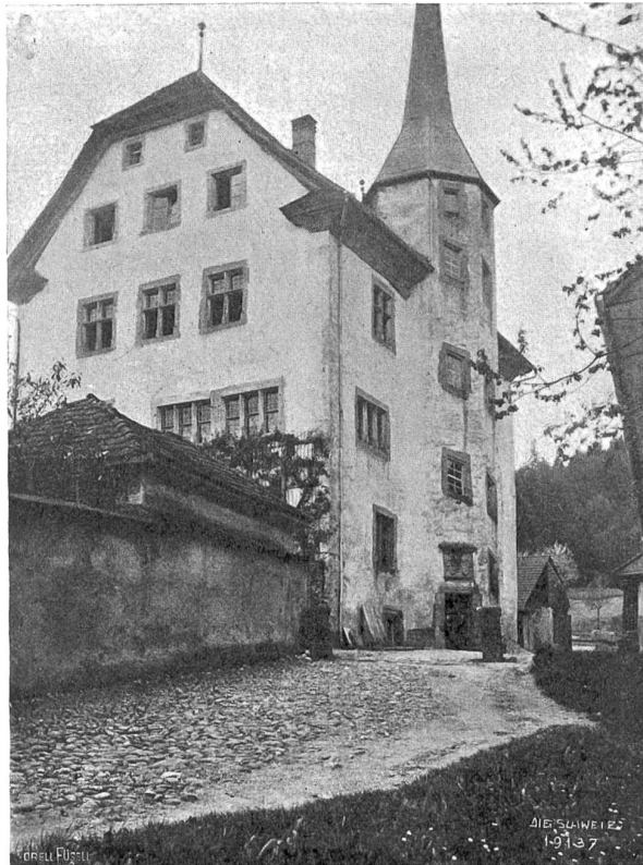
Altishofen Abb. 2. Schloß von Nordosten.

wie solche damals den Leuten mit Vorliebe zur Schau gestellt wurden. Auch der Helm des Turmes darf sich eines respektablen Alters rühmen und gewinnt besonders durch seine windschiefe Spitze ein eigenes Aussehen. Im Turm hängt auch die alte „Heidenglocke“ aus dem vierzehnten Jahrhundert.