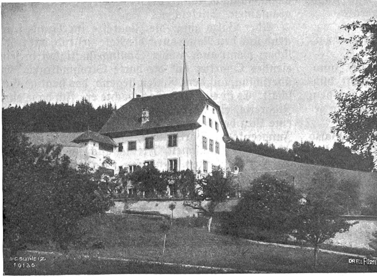
Altishofen Abb. 1. Schloßli von Südens.

klopfte dann ernsthaft auf seine Achsel und sagte: „Borgestern wollte ich dir eine Ohrfeige geben.“