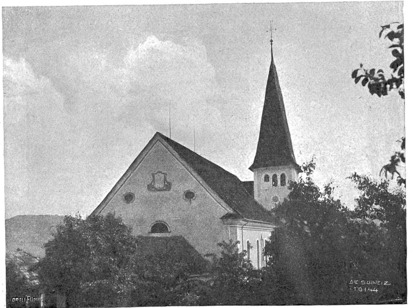
Altishofen Abb. 5. Kirche vom Schloßgarten aus.

Wie in vielen andern, von der „Kultur“ noch nicht allzu sehr verunstalteten luzernischen Gemeinden begegnen wir auch in Altishofen noch einer besonders anheimelnden altertümlichen Gebäudegattung, ich meine die mehr als hundertjährigen Speicher, die wohl das beste Zeugnis ablegen für