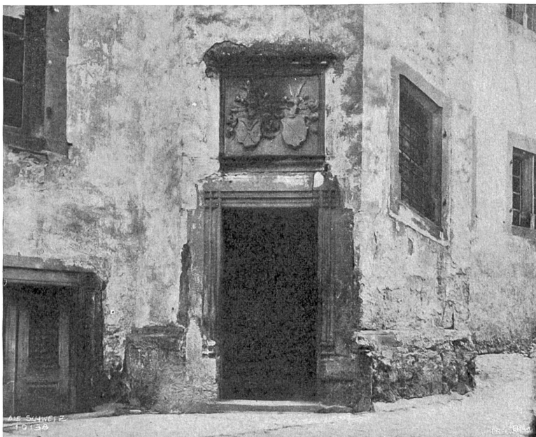
Altishofen Abb. 3. Portal am Schloßtürm.

Ueber die dicht aneinander gereihten Gräber des Friedhofes ragt ein kunstreich gearbeitetes Sandsteinkreuz aus dem Jahre 1636, das oben einen zwar dörflich, aber dennoch innig empfundenen Christus trägt und in der Mitte des Schaftes in einer barocken Mandorla den heiligen Martin im Bischofsornat mit dem nackten, am Boden kauenden Bettler zeigt. In die Flanken des Kreuzesstammes sind in niedrigem Flachrelief ornamentale Motive, zumeist Imitationen von Metallbeschlägen, gehauen. Die Rückseite schmücken Rosetten und Akanthus-schnörkel. In ein kartuschenförmiges Oval am Fuße des Kreuzes ist hinter einem Totenschädel folgende Inschrift eingegrift: