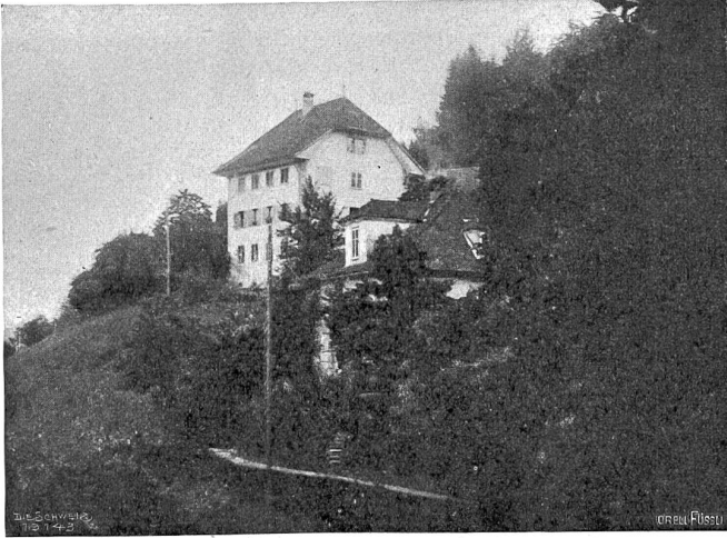
Altishofen Abb. 4. Pfarrhaus (18. Jahrh.).

Gar zierlich siehst by diesem Bild wie Gott der Höchste König mildt demuetiglich mit großem Schmerz verwunden ließ d'händ Fueß und s'Herz am Kreuz mit Spot gar leidt den Todt auf das er d'weldt erlöst aus Rodt.