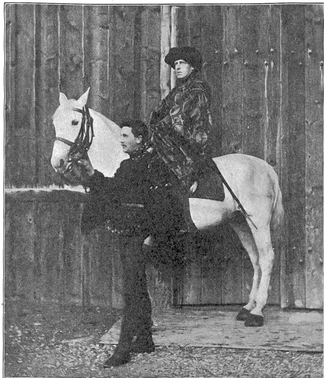
«Toll» zu Mézières. Geßler. Phot. Arts graphiques, Vevey.

Im ganzen genommen kann man sich des Eindrucks nicht erwehren, daß Morax mehr ein Iyrisches als ein eigentlich dramatisches Talent ist. Seine Personen reden sehr viel. „Ce Tell a fait son bachot et sa thèse,“ sagte ein Genfer neben mir. Er bewegt sich, Schiller nochmals getreu, in einer Reihe schöngebauter Sentenzen. So trefflich es Morax gelingt, seinen Leuten aus dem Volke kurze Sätze in den Mund zu legen, die für ihre Art überaus charakteristisch sind, so sehr werden seine Haupthelden im längeren Gespräch zu Kanzelrednern. Dann fehlt es nicht selten bei ihm am eigentlichen dramatischen Aufbau. Wie meist bei den Franzosen haben wir auch hier „Szenen“, Einzelwirkungen und in sich geschlossene, untereinander wenig zusammenhängende Bilder. Das eigentlich synthetische Moment, der systematische Aufbau, das Drängen zur Katastrophe, der Aufstieg zum Konflikt fehlen ganz oder zeitweise. Man hält sich unterwegs zu viel auf, vergißt sich auch wohl und besinnt sich dann wieder. Derartig gebaute