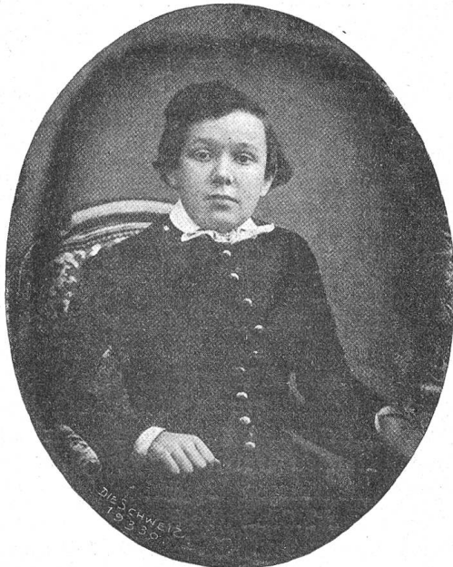
Carl Spitteler als Kadett. Nach Daguerreotyp von 1856.

„Ja warum, wenn man es doch kann, fahren nicht alle Menschen alle Wochen nach Liestal?“ fragt der junge Carl Spitteler in seinen „frühesten Erlebnissen“. Warum denn nicht? Dieses Liestal, das Land der einstigen Sehnsucht des Dichters, muß ja eine Märchenwelt sein, wie sie nur die Phantasie ersinnen kann, und existiert wohl nur in des Dichters bilderreichen Träumen? Keine Spur von alledem. In leibhaftiger Gestalt liegt die kleine Jurastadt friedlich ins Grüne gebettet am Ufer der Ergolz. Treue Wacht hält seit undenklichen Zeiten gegen alle rauhen Winde der Schleifenberg, der, wie Widmann sagt, einem ruhenden Löwen gleich daliegt. Abgesehen davon freilich, daß es Ende des achtzehnten und anfangs des neunzehnten Jahrhunderts als Erzrevoluzzernebst galt, von Napoleon sympathisch begrüßt, und schließlich nach langen Kämpfen die Hauptstadt des neuen Kantons Baselland wurde, weiß die Geschichte nicht viel von ihm zu sagen. Aber manch ein aus deutschen Landen kommender Italiener hat im behäbigen „Schlüssel“ sein Haupt niedergelegt; alles mögliche flüchtige Volk suchte besonders in den dreißiger bis fünfziger Jahren des vorigen Jahrhunderts in den alten heimeligen