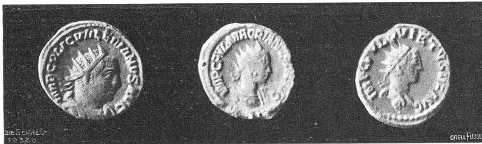
Orientalische Gepräge der Kaiser Valerian I., Macrian und Quietus.