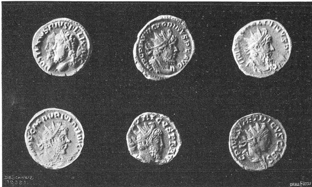
Gallische Gepräge der Kaiser Postumus, Victorin, Laelian, Marius, Tetricus I. und Tetricus II.

Münzen kaufte; das war in den ersten Jahren des zwanzigsten Jahrhunderts. Die Sammlung wuchs rasch. Die römischen Gepräge aus den Kollektionen Wilhelm Bachofen und Stamm-Preiswerk wurden sein Eigen. Dann eine weitere Basler Sammlung von etwa zwölfhundert Kaisermünzen, die Berner Kollektion Pauly, die Römer der Sammlung Denzger in Gelterkinden und andere zahlreiche Funde aus der Umgegend, aus dem Aargau, Baselland, dem Berner Jura und aus dem Badischen wurden Bischoff zugetragen. In Konstanz, München und den Rheinlanden gelangen ihm günstige Erwerbungen. So wuchsen Bischoffs Münzreihen rasch zu einer wissenschaftlich brauchbaren Sammlung an; mustergültig bestimmt und geordnet stand sie Forschern offen, wurde bereitwillig