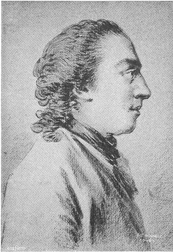
Heinrich Füßli, genannt „Londoner Füßli“ (1741-1825).