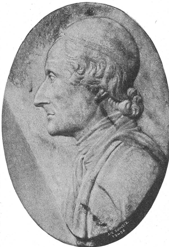
Joh. Caspar Lavater (1741-1801).

So bekommt der Schweizerische Sturm und Drang eine ganz eigene Färbung. Und noch in andern Punkten hebt er sich deutlich ab von der deutschen Genie-