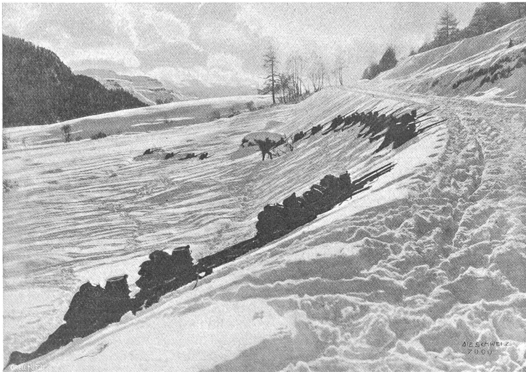
Schweiz. Grenzbesetzung: Infanterie-Schützenlinie während einem Gefecht.

Den Italienern ist es nach mehr als halbjähriger Kriegführung noch nicht gelungen, auch nur einen wirklich imponierenden und überzeugenden Erfolg zu erringen. Zu gern hätte man der Kammer bei ihrer Wiedereröffnung im Dezember wenigstens eine befestigte österreichische Stadt als Siegesbeute präsentiert; es sollte nicht sein, trotz den ungeheuersten Anstrengungen der italienischen Armee,