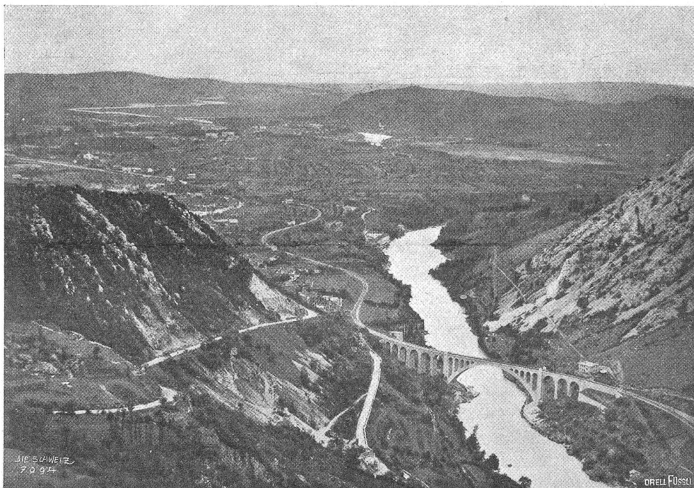
Am Ifonzo. Links Monte Santo, rechts Monte Sabotino. Im Hintergrund Görz mit Podgorahöhe.

ihrem Bestimmungsort beim Militärposten Binn eintreffen und am nächsten Tage wieder in Berisal zurück sein sollen. Als man am Freitag noch keine Spuren von der Patrouille hatte, mußte man Schlimmes befürchten, und unverzüglich machten sich ein halbes Duzend Hilfsexpeditionen, bestehend aus Militär- und Zivilpersonen, auf verschiedenen Wegen auf die Suche. Am 20. November fand man in Form gebrochener Skier Spuren der Vermißten, und man mußte sich mit der erschütternden Erkenntnis abfinden, daß der ganzen Patrouille ein Unglück zugestoßen war. Der folgende Tag brachte die Bestätigung. Unter einer Lawine bei Heiligkreuz in 2½ m Tiefe fand man die Leichen