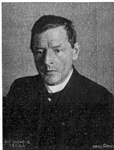
Heinrich Federer.

Alle Achtung vor unserer Redaktionsstube, wenn sie auch so eng ist, daß der Papierkorb ein Gutteil ihres Raumes verschluckt (ihre Enge hat schon manchem Besucher den Rant gezeigt, den er von selbst nicht gefunden hätte); denn es steht eine tüchtige Arbeitsluft zwischen den bücher- und druckstockschweren Wänden, die oftmals ehrfürchtig erzittern vom unablässigen Gestampfer ferner Maschinen, und sie hat ein Fenster, das gradwegs auf den schönsten Platz mit den graudüsteren Türen und lustigen, kinderfrohen Trepplein schaut und weiter über den schönsten Weidenbaum, über Fluß und Berg ins Himmelblaue hinein. Aber Sonntagsstille steht der Arbeitsstube nicht, und wenn man weiß, daß diese selbe Septembersonne, die den Platz vor dem Fenster weiß macht und das Auge verglastet, den andern einen blaufunkelnden Weg über den Urnersee zeigt und daß man mit dabei sein