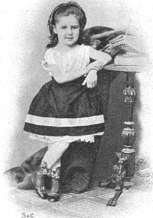
Isabelle Kaiser im Alter von fünf Jahren (1871).

rein äußerliche Zweisprachigkeit. In meiner Vorstellung und nach meinem Urteil gehört Isabelle Kaiser klar und einfach zu den Dichtern der romanischen Schweiz. Denn auch da, wo sie in deutscher Sprache auftritt, offenbaren sich Merkmale romanischer Gefühls-, Denk- und Sprachweise. Sondern durch die Wucht des poetischen Dranges, der gebieterisch die Aussprache verlangt, durch die schwungvolle Gebärde des Gedankens und des Rhythmus, durch die stolze Pracht der Vergleiche, durch den lauttönenden Klang des Wortes und des Reimes. Wie uns Schubert selbst in seinen nachlässigsten Stücklein mitunter zu bewunderndem Seufzen zwingt, so geschieht es mir, daß ich oft mitten in einer minder bedeutenden Probe von Isabellens Poesie plötzlich mit dem Fuß stampfe: „Donnerwetter, solch eine Wendung findet doch einzig in der Welt Isabelle!“ Poesie