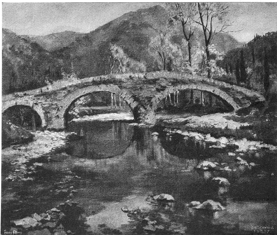
Jeannette Gauchat (1871—1915).